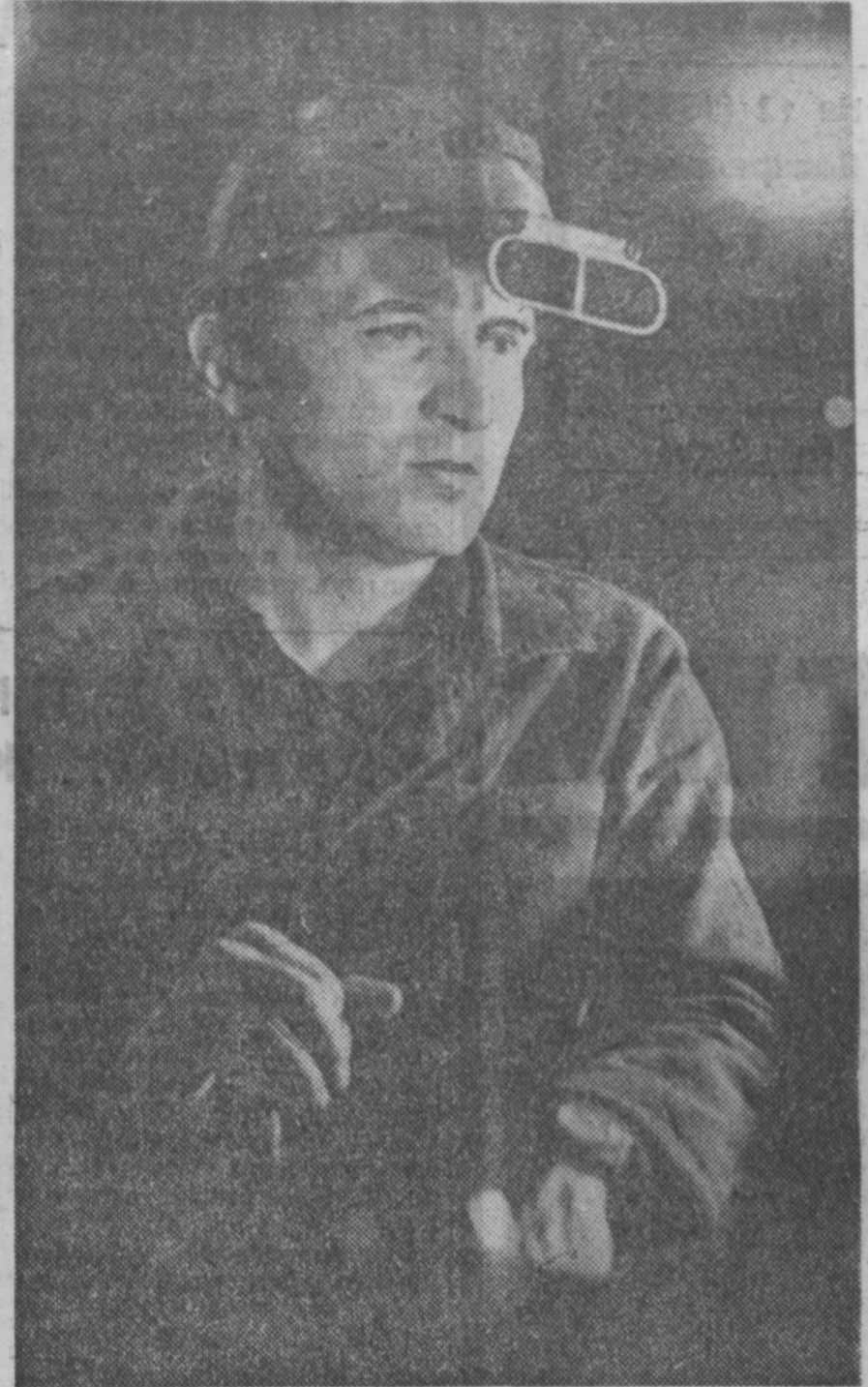
Конверторщики Запсиба в прошлом году дополнительно к плану выдали десятки тонн стали. Выяты обязательства и на 1973 год...