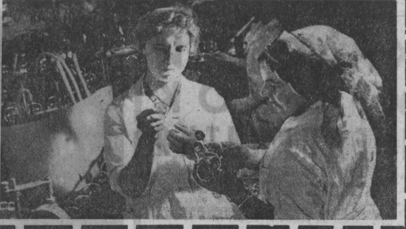
Ежедневно эта бригада изготавливает свыше 11 тысяч электраламп. Экономия полуфабрикатов на линии составляет ежемесячно более 500 рублей.