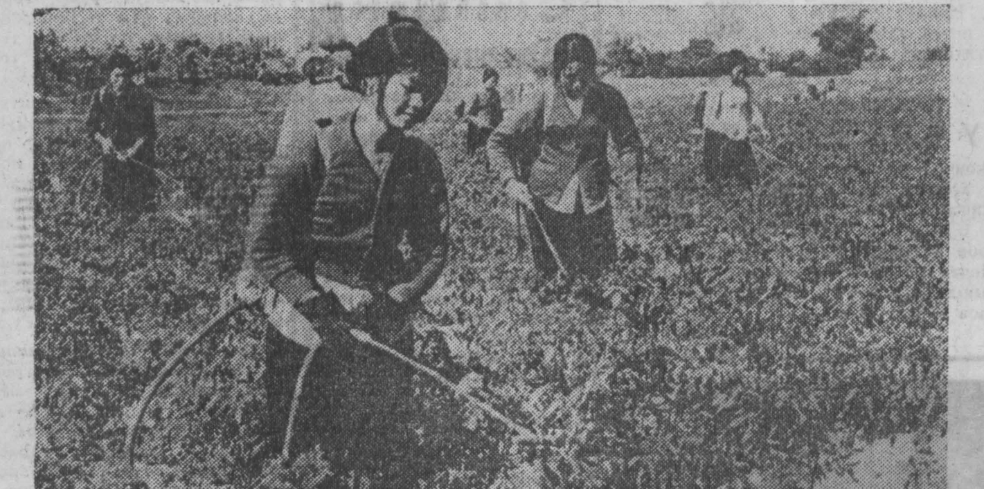
ДРВ. Много сил и труда затрачивают сельские крестьяне на выращивание зернохозяйственных культур, но и земля платит им щедро, давая в год по несколько урожаев риса, овощей и других культур. НА СНИМКЕ: внесение удобрений на овощной плантации.

ПОМНИТЕ СОВРЕМЕННЫЙ РЕМОНТ ОБУВИ ПОЗВОЛИТ УДОВЛЕТВОРИТЬ СРОК ЕЕ НОСКИ. Дирекция фабрики № 3.