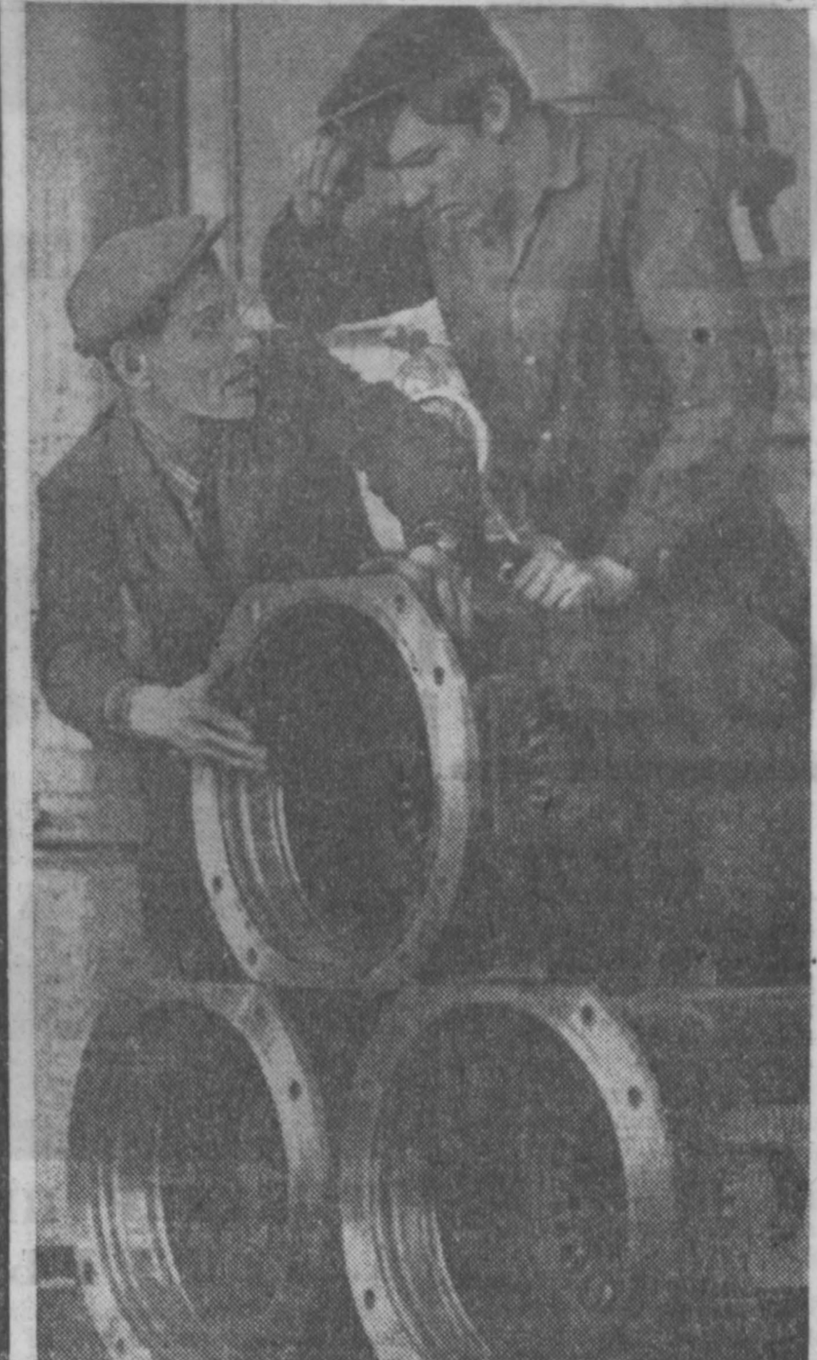
Ежемесячно свыше 800 электродвигателей И03-5 отплавляет потребителям сборочный участок четвертого цеха завода «Кузбассэлектромотор».

Материал с таким названием был напечатан в «Кузбассе» 23 марта с.г. В нем речь шла о низких темпах строи-