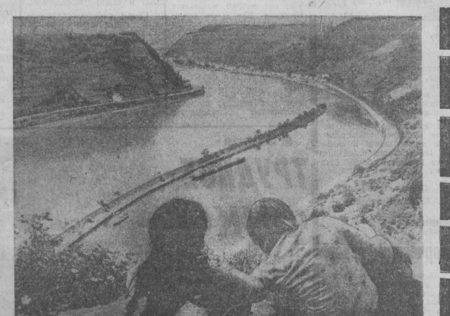
ФЕДЕРАТИВНАЯ РЕСПУБЛИКА ГЕРМАНИЯ. Долина реки Рейн у Санкт-Гурсау. Этот вид открывается с 132-метровой скалы легендарной Лорелы.

Массовая безработица, беспросветная нищета, рост стоимости жизни и разгул реакции — эти «блага» принесло Португалии режим диктатора. НА СНИМКЕ: пастух в поисках работы.