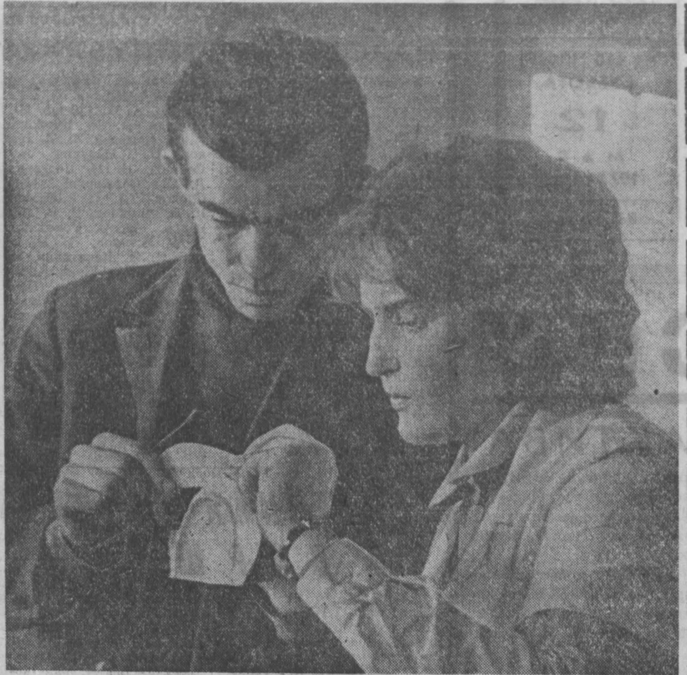
Коллектив Прокопьевского фарфорового завода недавно выдвинул новую проблему... Сейчас на предприятии идет освоение оборудования.