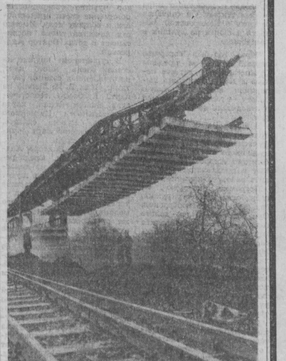
Строители железных дорог Магдебурга получили из Советского Союза рельсоукладочную машину, что во многом разгрузило труд рабочих и ускорило прокладку железнодорожных линий. НА СНИМКЕ: прокладка железнодорожной линии в округе Шверин с помощью советской рельсоукладочной машины.