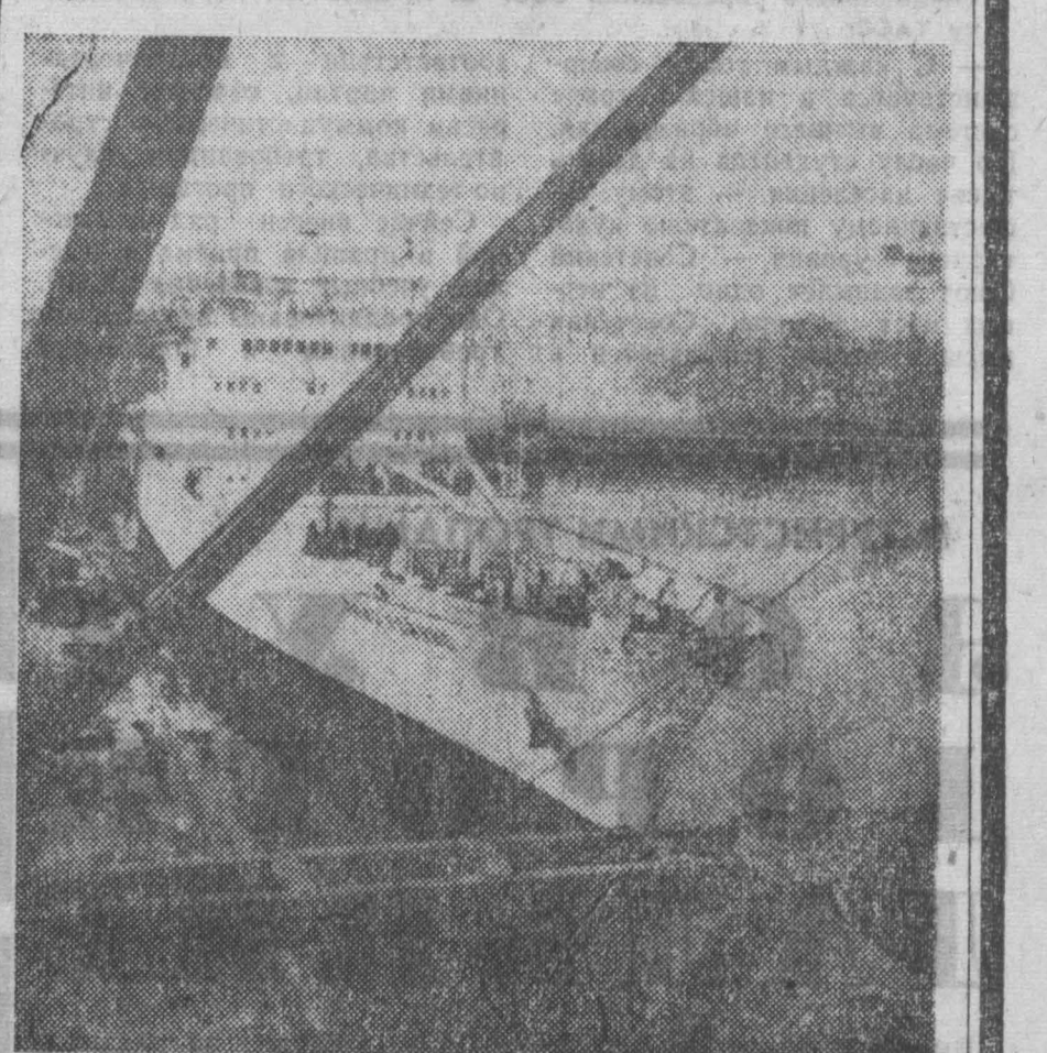
Самым крупным заказчиком польской судостроительной промышленности является Советский Союз. По его заказам в Польше строятся рыболовецкие суда, уголь и рудовозы, гидрографические, исследовательские и пассажирские суда. В текущей пятилетке Польша поставит Советскому Союзу 109 судов общим водоизмещением 880 тысяч тонн. НА СНИМКЕ: рефрижераторное судно «Юнис Райнск», построенное по заказу СССР, на верфях судостроительного завода им. В. И. Ленина в Гданьске.