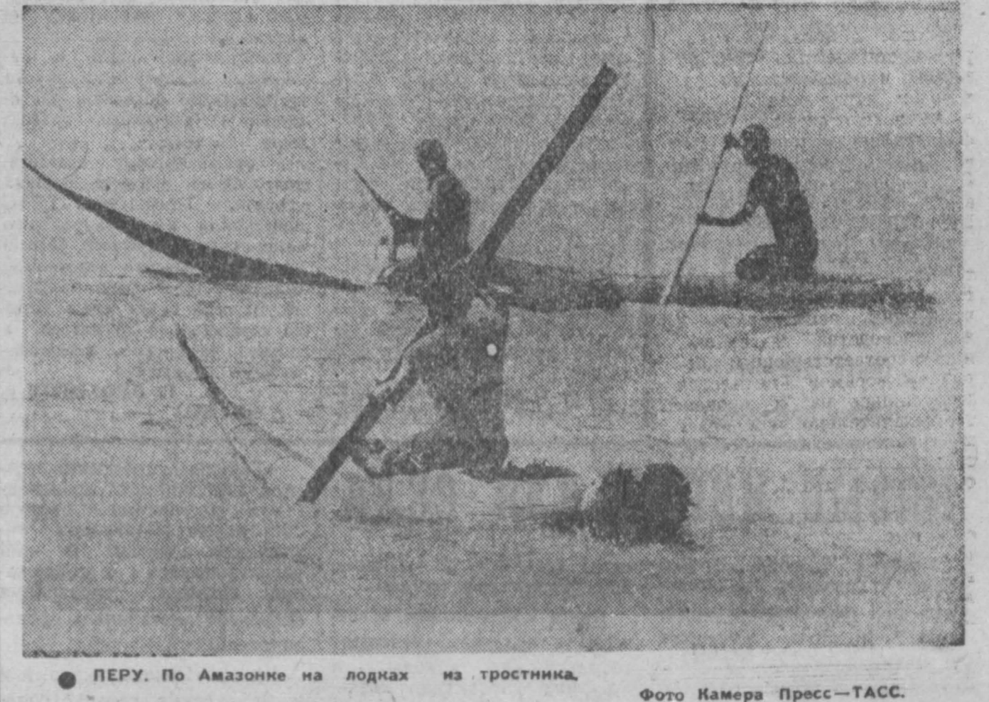
ПЕРУ. По Амазонке на лодках из тростника.

Согласно официальным сведениям, в восьми лагерях на острове Коншон осталось еще девять тысяч заключенных. (ТАСС.)