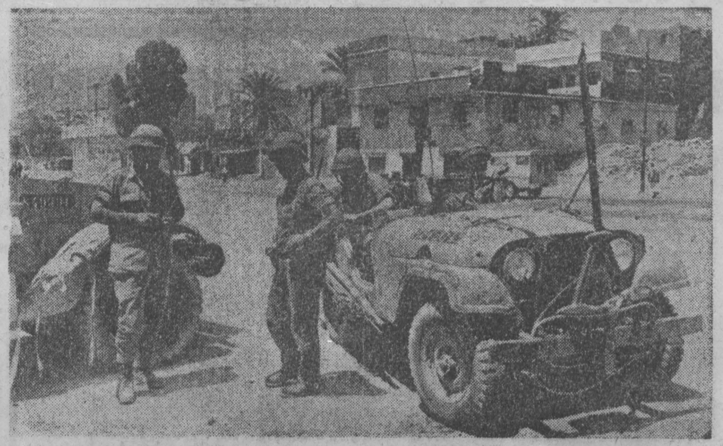
Продолжается террор парализованных воинов на оккупированных арабских территориях в результате агрессии 1967 года. Оккупанты разрушают дома жителей — арабов, строят кварталы новых зданий, спешно переселяют сюда израильских граждан.

АФИНЫ (ТАСС). В Греции ширится кампания за освобождение политических заключенных, арестованных после военного переворота 1967 года и осужденных чрезвычайными военными трибуналами. Из различных городов страны в адрес властей поступают отдельные и коллективные письма греческих граждан. В них содержится требование провести амнистию политических заключенных. Важное значение в этой кампании имело открытое письмо 470 журналистов, писателей, ученых, артистов, опубликованное в первых числах января.