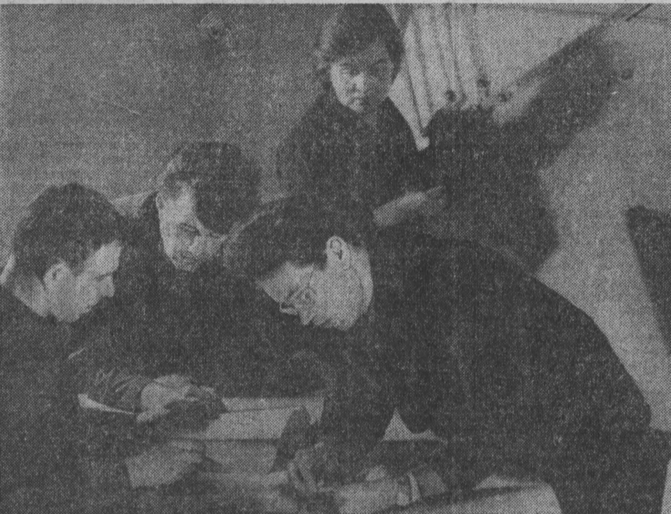
В этой пятилетке предстоит максимально механизировать добычу угля на Проктопекенско-Киселевском месторождении. В числе тех, кто занимается этой работой, — научные сотрудники КузНИИ. Здесь решаются комплексные проблемы создания средств механизации для шахт.

В течение трех лет решено внедрить комплексную механизацию на всех существующих и вновь строящихся фермах, увеличить нагрузку на каждую дольку с 28 до 50 коров, поднять производительность труда животноводов примерно в полтора раза.