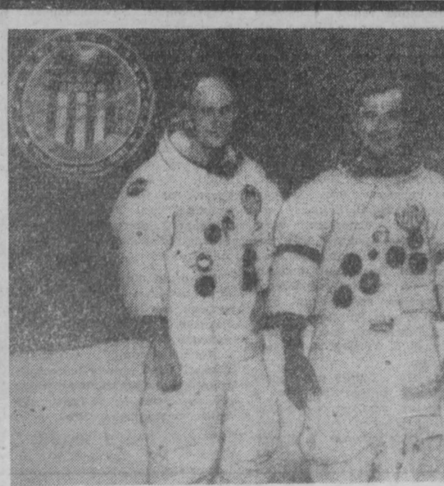
НА СНИМКЕ: американские космонавты (слева направо) Томас Маттингли, Джон Янг и Чарльз Дьюк перед полетом.