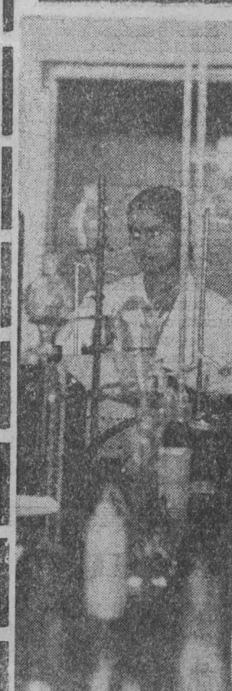
«Этот заповедь — еще одна веха в истории развития индико-советского сотрудничества» — мраморная планета у входа на завод по производству химико-фармацевтических препаратов в Хайderabadе.

Вчера отмечался Международный день солидарности молодежи. Как встретила юность планеты свой праздник — смотр сил, стойкости и единства? Во всех странах широко была развернута всемирная кампания «Юность объединяет империализм». По всем континентам прошли и идут марши протеста, манифестации, конференции по актуальным проблемам антиимпериалистической борьбы, сбор и публикация материалов о преступной деятельности империалистических государств и капиталистических монополий. Некогда апологеты капитализма убеждали, что в современных условиях происходит некая «интеграция» молодежи в капиталистическую систему. Ныне от этой «теории» остается один обломок. Молодежь отвергла многочисленные специально сконструированные идеологические концепции «великого общества», «народного капитализма», «массовой культуры» и им подобные. Ушли в прошлое времена, когда молодежь ограничивалась маталивым протестом, эпатирующими фортами, боями (киши, битвы и т. д.). Во многих странах ширится мощное активное движение молодежи. В сентябре 1971 года в Чили прошла Международная встреча солидарности молодежи Северной и Латинской Америки с народами Вьетнама, Лаоса и Камбоджи под лозунгом «Молодежь мира объединяет империализм».