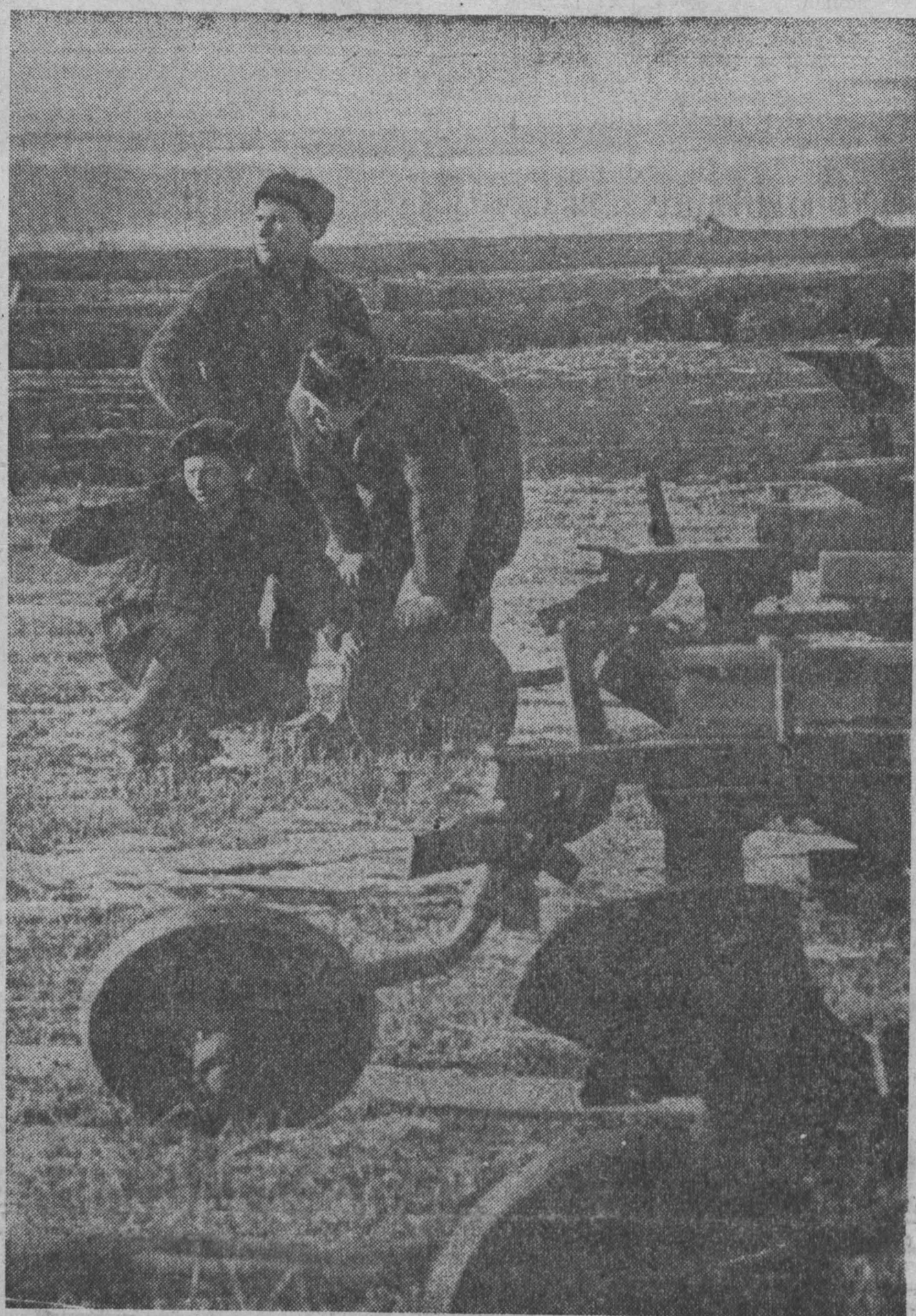
Хорошо подготовились к весенним работам механизаторы фермы № 2 совхоза «Тамбарский». В боевой готовности трактора, сеялки, прашивной ивентаря, протравлены семена.

ВЫЗНАЙТЕ РЕДАКЦИЮ ГАЗЕТЫ «КМЗБДЖ» НА ЗАПИСЕ.