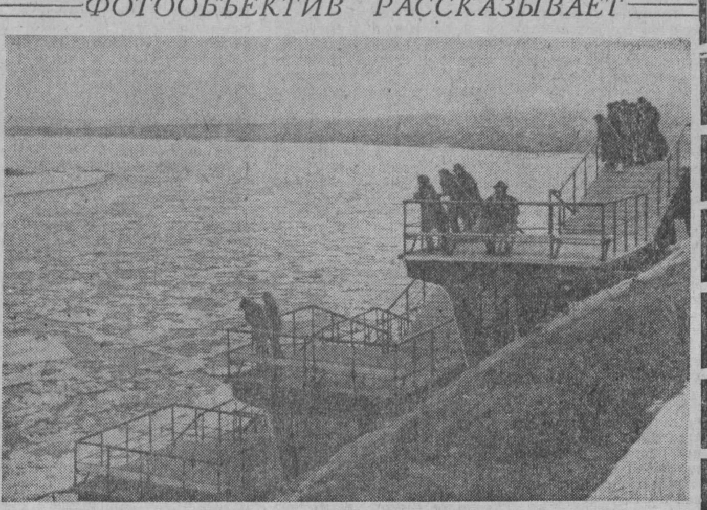
ПОЛОВОДЬЕ НА ТОМИ.