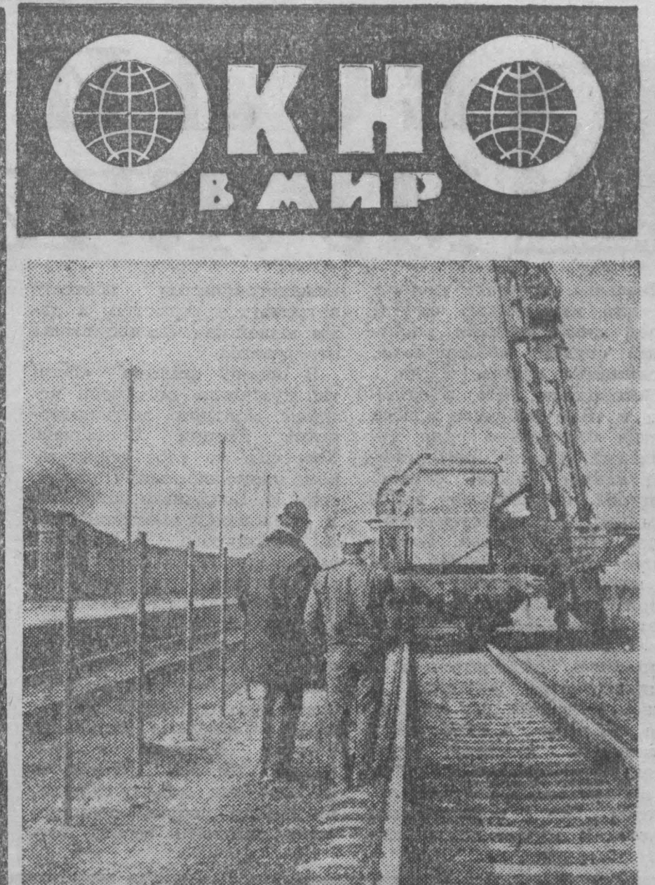
Одним из важных мероприятий по осуществлению Комплексной программы стран-участниц СЭВ является проведение первых операций Международного инвестиционного банка, который предоставит кредиты ВНР и ПНР. Полученный ВНР кредит в сумме 33,2 миллиона рублей реализуется страной для модернизации железнодорожного транспорта, реконструкции действующих и строительства новых предприятий. НА СНИМКЕ: начальный этап работ по электрификации железнодорожной линии протяженностью 220 километров, соединяющей Будапешт с венгерско-румынской границей. Работы ведутся за счет средств, полученных Венгрией от инвестиционного банка, и должны быть закончены к 1974 г.

Если выяснится, что у Федеративной Республики нет желания сотрудничать с нами, мы, естественно, должны будем это констатировать и сделать соответствующие выводы. Логика политического развития говорит о том, что не вступление договоров в силу отбросило бы советско-западногерманские отношения в заднюю точку. Мы считаем, что у нас нет оснований для пессимизма. Мы считаем, что у нас есть все возможности для дальнейшего углубления сотрудничества. Мы считаем, что у нас есть все возможности для дальнейшего углубления сотрудничества. Мы считаем, что у нас есть все возможности для дальнейшего углубления сотрудничества. (ТАСС).