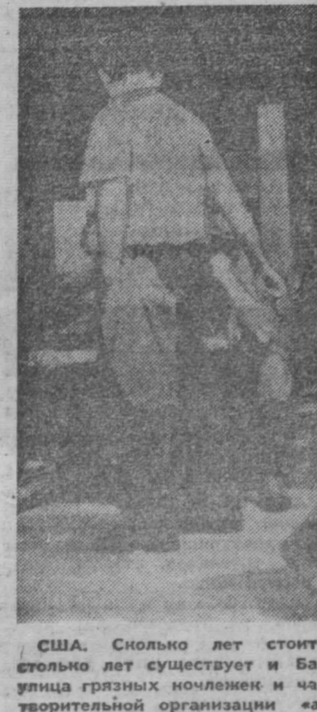
США. Сколько лет стоит Нью-Йорк, столько лет существует и Баугур-сити...