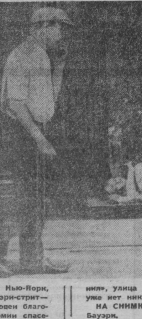
улице, улица бездомных бродит, у которых уже нет никаких надежд.