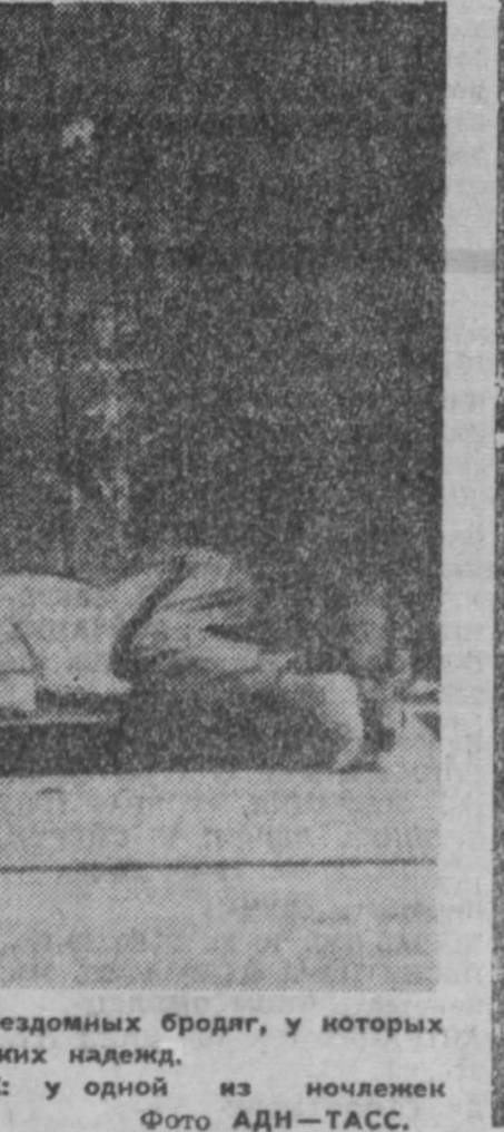
НА СНИМКЕ: у одной из женок Баугур.