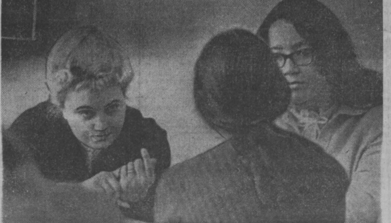
В вузах идут экзамены. Репортаж об экзаменационной сессии читайте на 4-й стр.