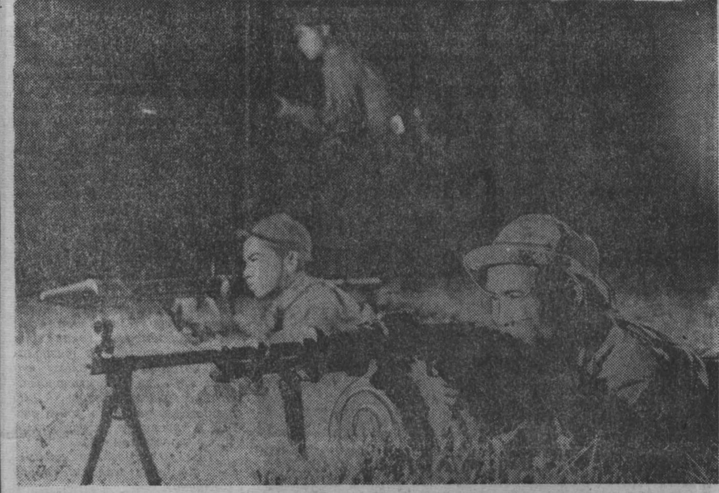
Бойцы Народных вооруженных сил освобождения Южного Вьетнама в провинции Куанчи на боевых позициях.