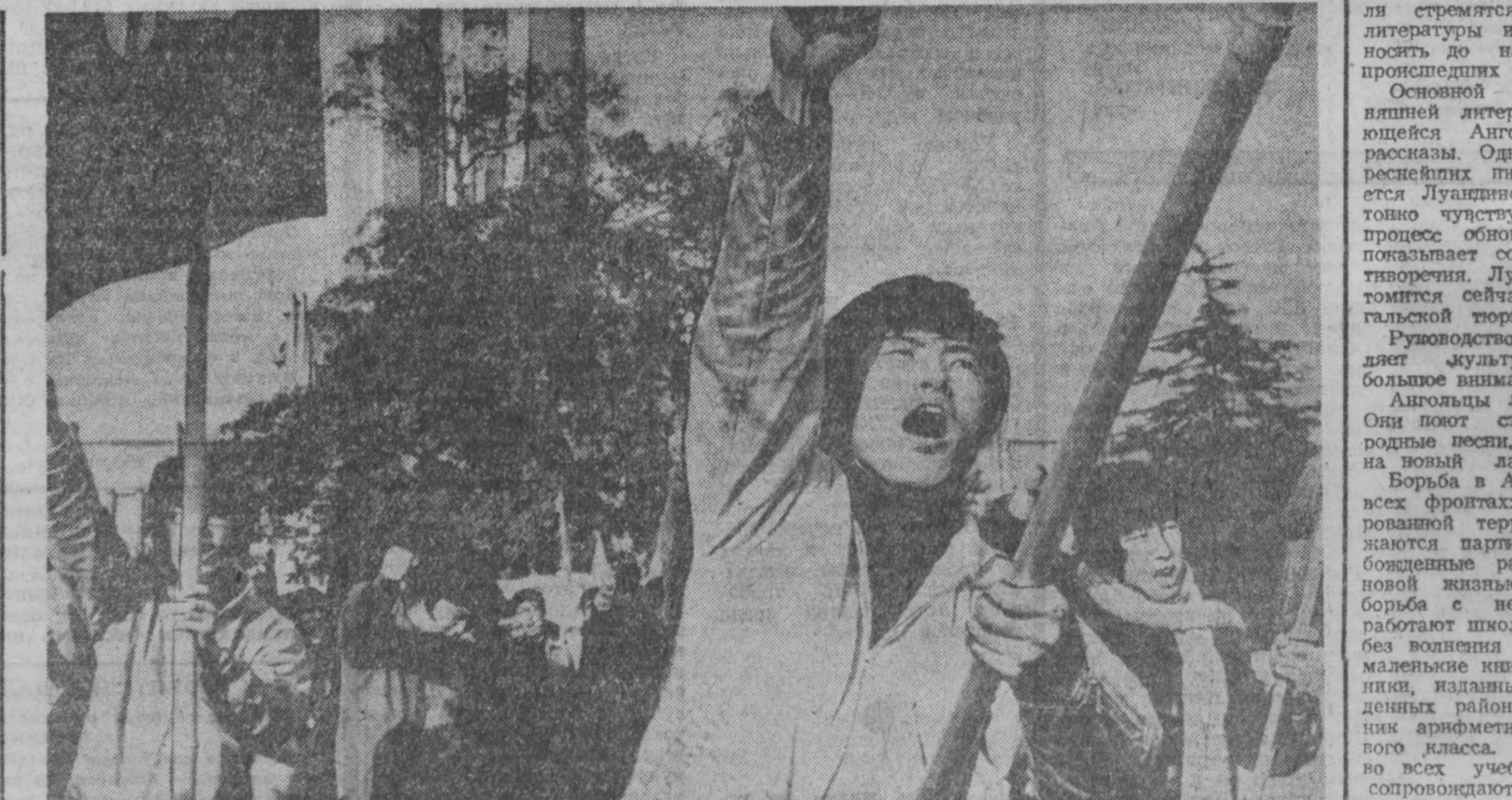
ЯПОНИЯ. Весна — традиционное время сплоченной борьбы японских трудящихся за свои права. Первой ласточкой в этом году стали выступления студентов, которые последовали после объявления администрации токийского университета Васады о повышении платы за обучение на 200 процентов. Учиться в университете — роскошь, которую могут теперь позволить очень богатые люди.

— В моей пенсионной книжке, — сказал он между прочим, — есть запись: «Пенсионер по старости». И засмеялся. При чем здесь старость, если впереди еще столько дел! — Два родственника. Два мировоззрения. Два образа жизни. А. КАЛНИН, М. ЩЕРБАКОВ, г. Новокузнецк.