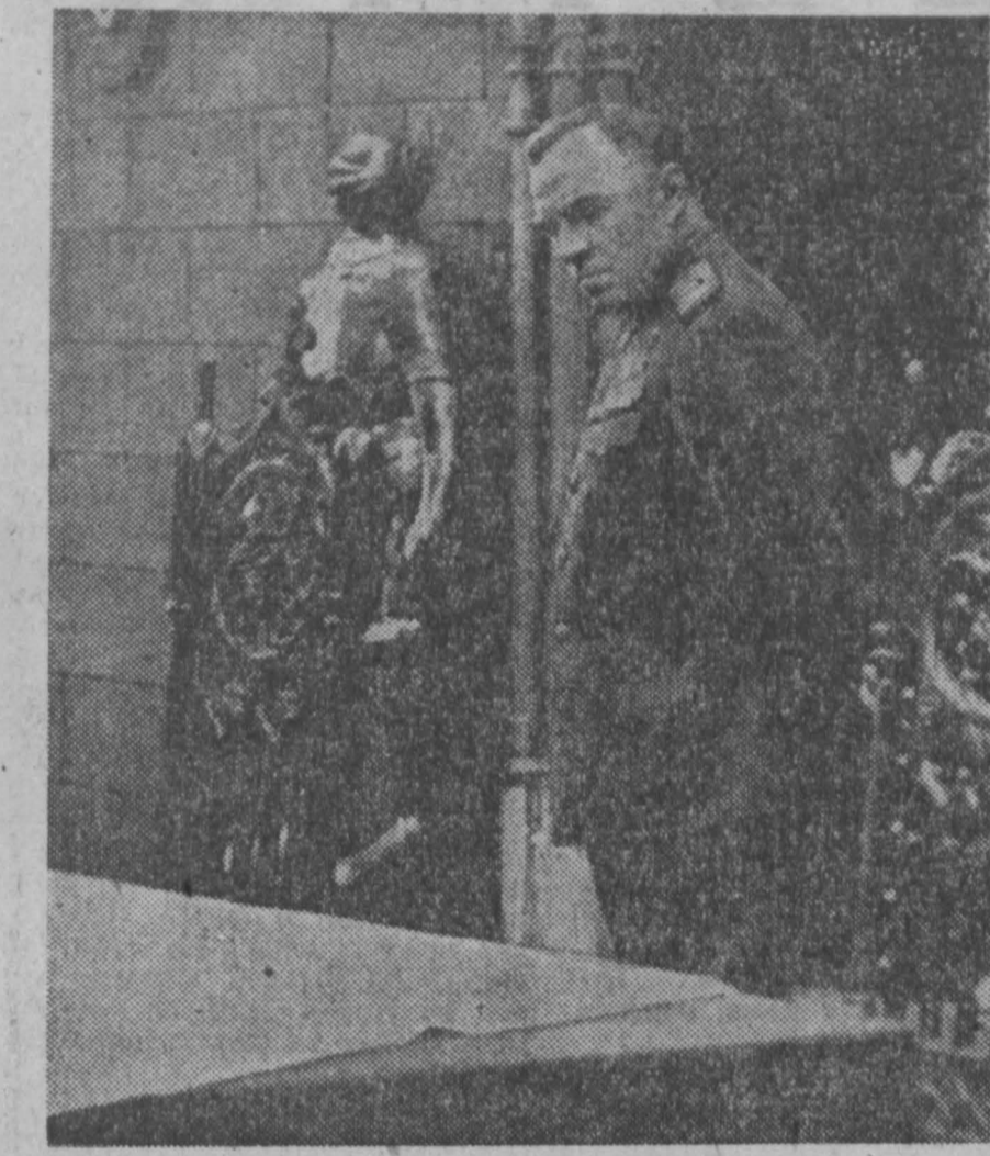
Кадр из фильма «Битва за Берлин». Маршала Советского Союза Г. Жукова — М. Ульянов.