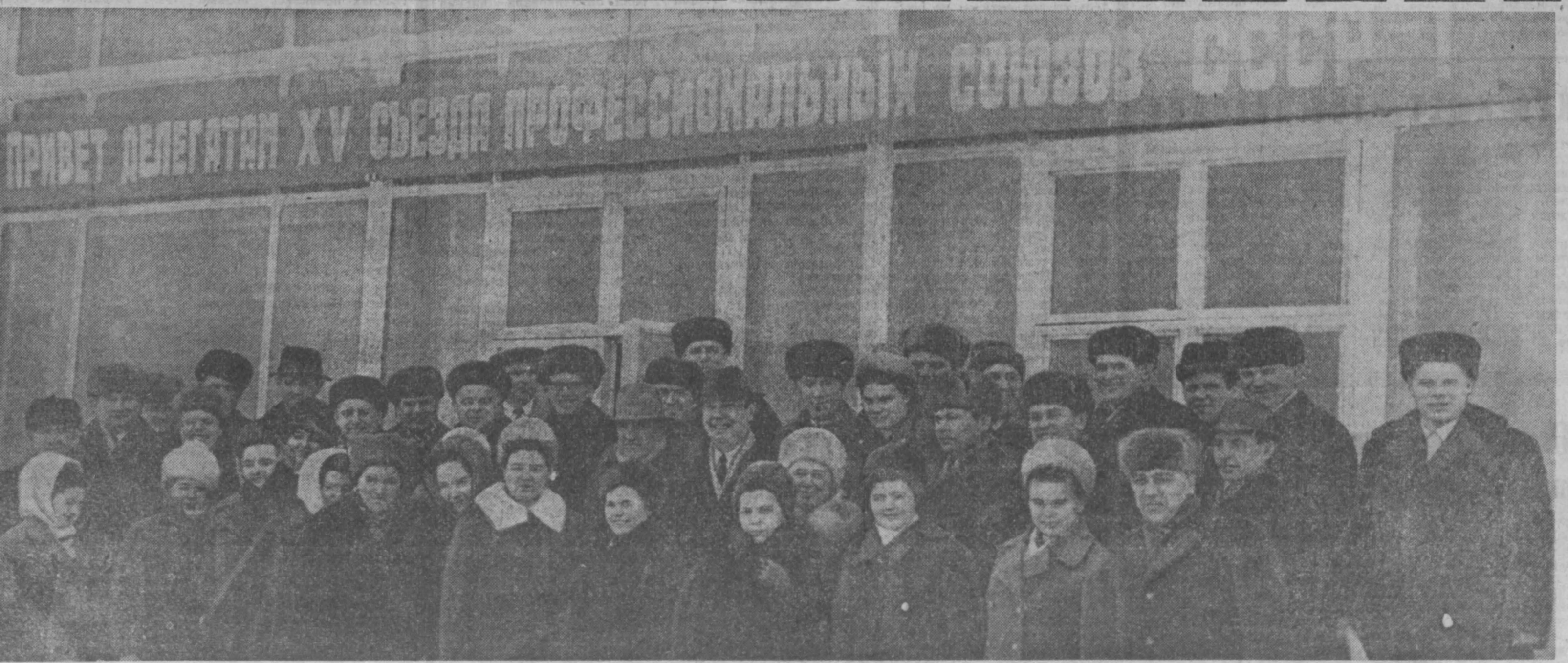
НА СНИМКЕ: кузбассовцы — делегаты XV съезда профсоюзов СССР, в Кемеровском аэропорту перед вылетом в Москву.

Советский опыт создания многонационального социалистического государства, построения развитого социалистического общества, решения национального вопроса получил мировое признание и оказывает неотъемлемую помощь всем борющимся за социальное и национальное освобождение. М. П. Георгадзе ответил на вопросы журналистов. (ТАСС).