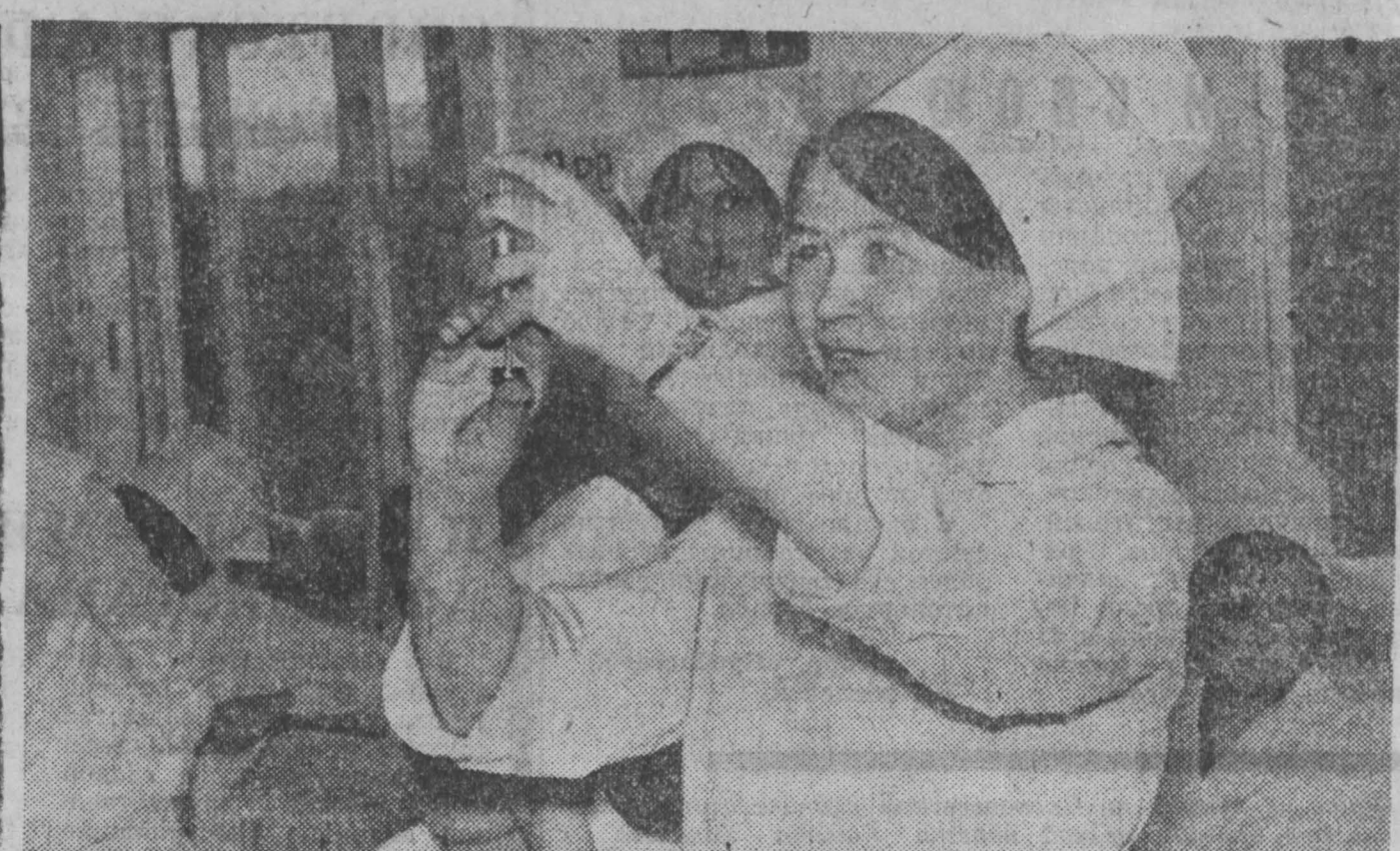
Несколько лет учебы в медицинском училище остались позади. Через две недели будущие медики отправляются на практику. По доброй традиции в училище проходила конкурс. Его девиз: «Светя другим — согреваешь...».

Вчера подружки-студентки пришли в редакцию нашей газеты и попросили — Пожалуйста, сообщите о нашей находке в газете. Мы верим, что после этого рассеянный человек непременно найдется, а мы будем рады вернуть ему его деньги. Нас он разыщет в общештатной № 1 политехнического института на Красноармейской, 115, в комнатах №№ 309 и 311.