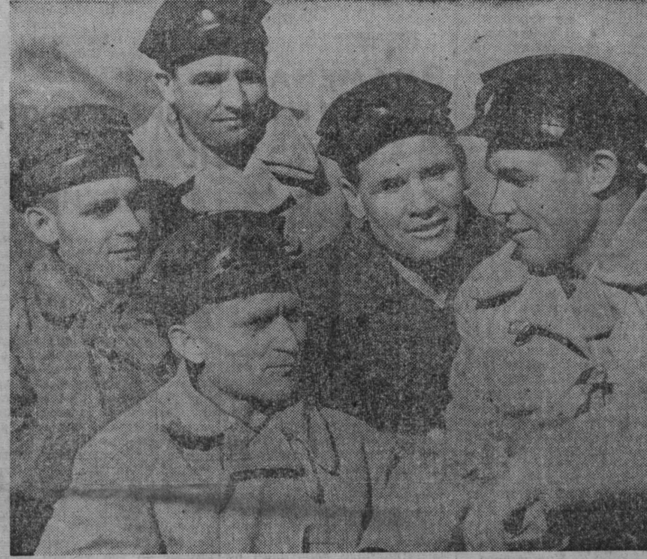
На Прокопьевском руднике славится коллектив шахты «Зиминка» комбината «Прокопьевскуголь».