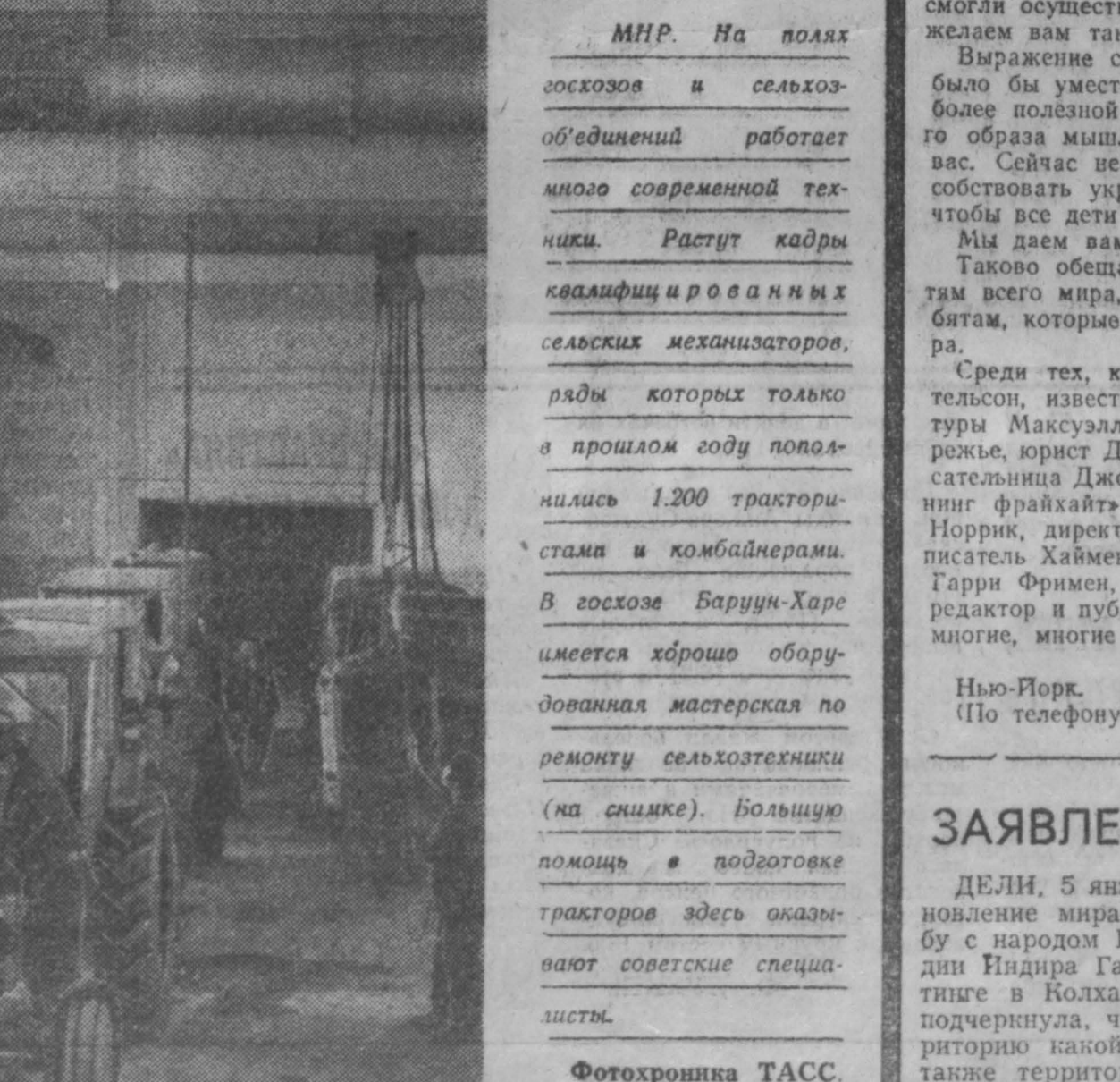
МНР. На полях госхозов и сельхозобъединений работает много современной техники. Растут кадры квалифицированных сельских механизаторов, ряды которых только в прошлом году пополнились 1.200 трактористами и комбайнерами.