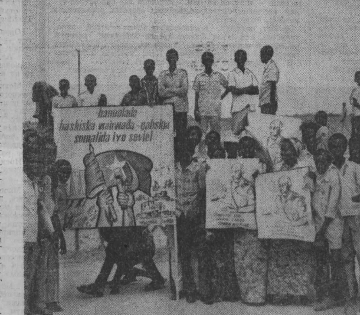
Между Советским Союзом и Сомалийской Республикой сложились отношения дружбы, сотрудничества и взаимопонимания. Советский Союз оказывает молодой республике моральную, политическую и материальную поддержку.