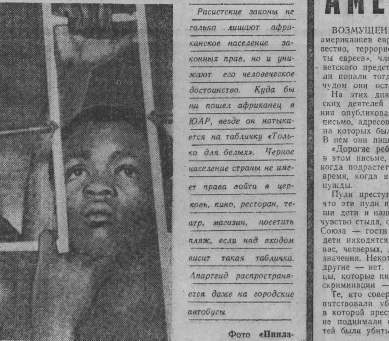
Эти юноши, как и сотни тысяч других борцов против апартеида, томится в тюрьмах ЮАР.

САНА. «Визит в Советский Союз был успешным», — заявил на аэродроме в Санае председатель республиканского совета ИАБ Абдурахман аль-Арьяни.