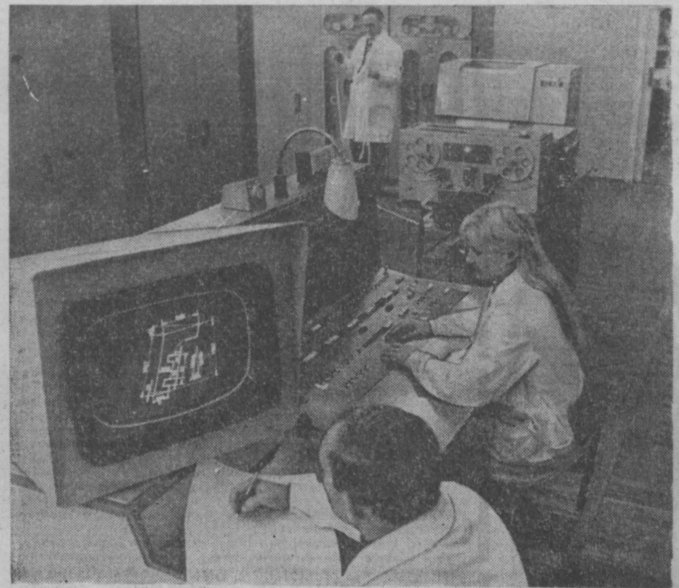
Ученые Харьковского научно-исследовательского института по проблемам оздоровления воздушного и водного бассейнов...