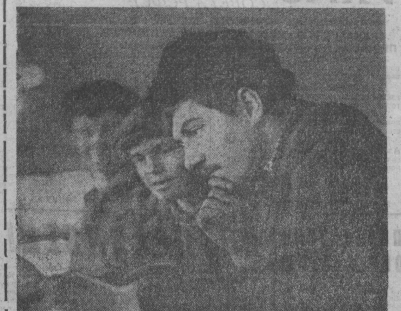
КОЛЛЕКТИВ ремонтно-механического участка кемеровского завода «Строммашина» ведет средний и капитальный ремонт станочного парка осевых цехов. Помимо этого, здесь модернизируют различные машины. Ремонтники работают отлачно, государственный план и обязательства они перевыполняют ежемесячно.

Почему же остался в стороне от этого важного мероприятия школы Рудничного района № 75 и № 46, директора которых знали о проведении районного родительского собрания?