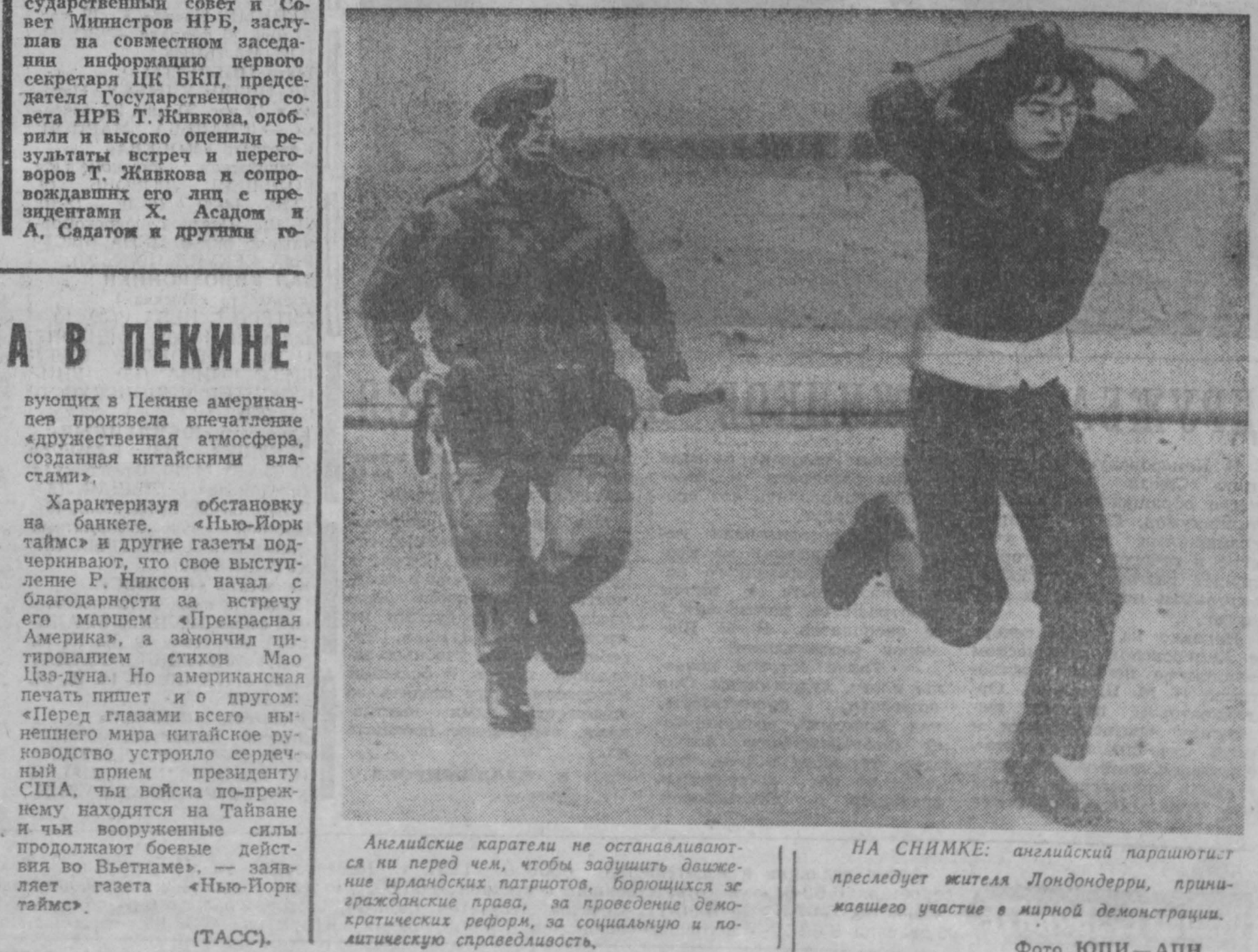
На снимке: английский парашютист преследует жителя Лондондерри, принимавшего участие в мирной демонстрации.