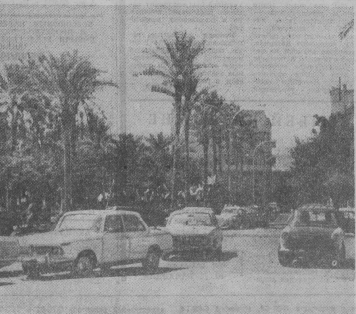
В центре Триполя — столицы Ливийской Арабской Республики.

В. ГУЩИН, соб. корр. АПН. Прага. (Окончание следует).