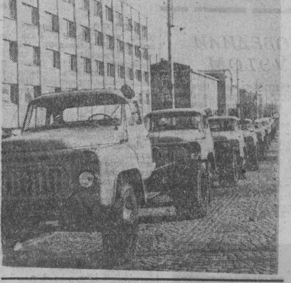
НА СНИМКЕ: продукция завода, готовая к отправке заказчикам.