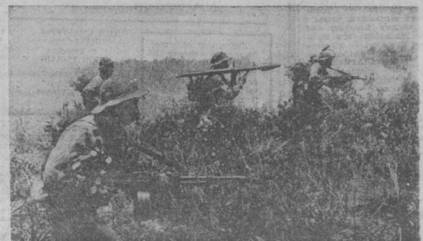
Народные вооруженные силы освобождения Южного Вьетнама продолжают наносить врагу сокрушительные удары. НА СНИМКЕ: южновьетнамские патриоты ведут бой.

ДЕЛИ. (ТАСС). Правительство Индии принимает меры по ускорению аграрных преобразований в стране в соответствии с программой социально-экономических реформ, отвечающих жизненным интересам индийских трудящихся. Как сообщил на заседании парламентского консультативного комитета по сельскому хозяйству государственный министр А. П. Шинде, правительствами штатов и союзных территорий уже распределено 13 миллионов акров пустующей земли, пригодных для обработки. В результате осуществления ряда прогрессивных мероприятий по установлению максимума земельной собственности, свыше 2,3 миллиона акров земли объявлены земельными излишками, подлежащими передаче индийскому крестьянскому движению. Государственный министр отметил существенный прогресс в проведении земельной реформ в целом ряде штатов страны. В соответствии с правительственной политикой все более заметную помощь крестьянам оказывают государственный банк Индии, а также национализированные правительством основные коммерческие банки.