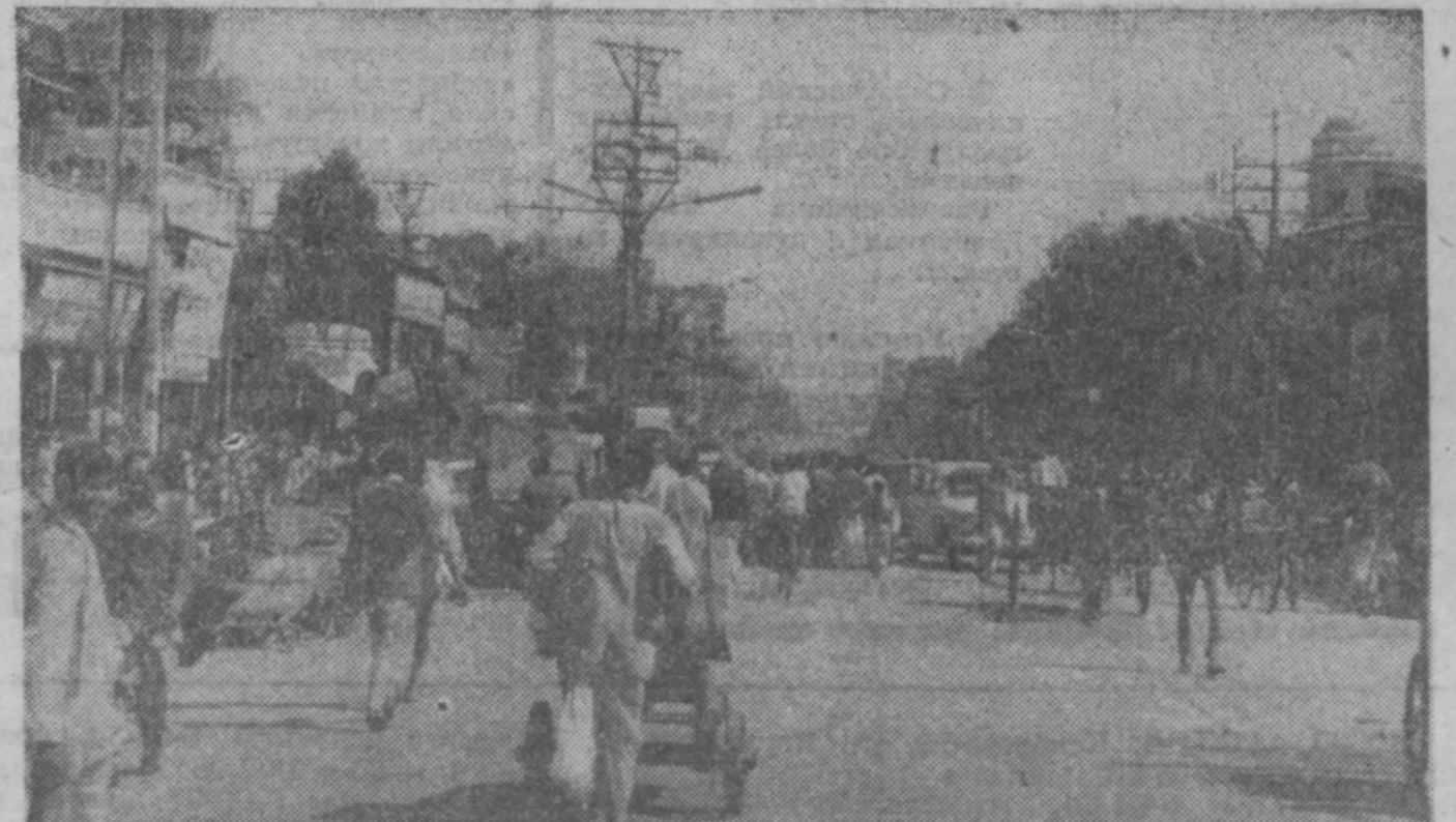
ДЕЛИ. Чандни-Чоук (улица луплого чета) — одна из наиболее оживленных магистралей индийской столицы, торговый центр старой части города.