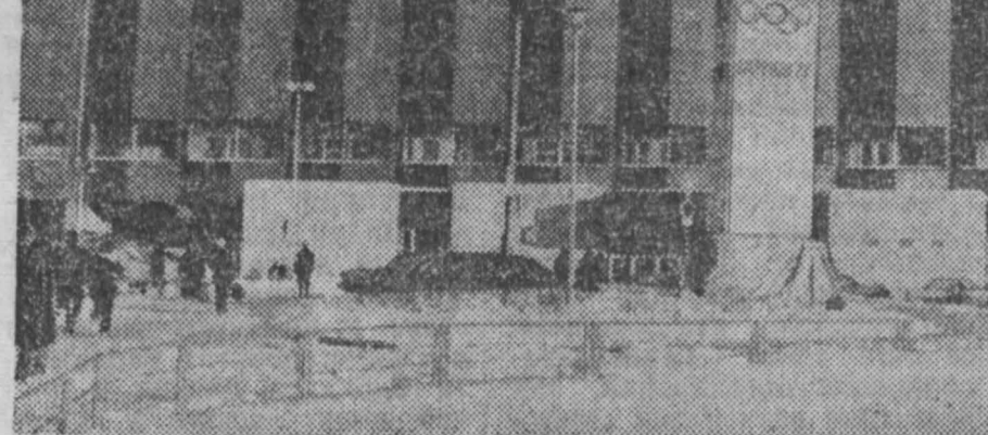
Столица XI зимних Олимпийских игр — Саппоро живет в ожидании начала Олимпиады. Спортивные сооружения и олимпийская деревня готовы к проведению соревнований и приему гостей. В олимпийской деревне уже разместились спортсмены из Австралии, Италии, Канады, Швеции, Японии и других стран. Прибыли и советские спортсмены. К Олимпийским играм в Саппоро и его окрестностях построено четырнадцать крупных спортивных сооружений. В их числе конькобежный стадион на 46 тысяч зрителей, крытый каток, вмещающий 12 тысяч человек, 90-метровый трамплин. НА СНИМКЕ: рядом с олимпийской деревней установлен обелиск с эмблемой Олимпиады.