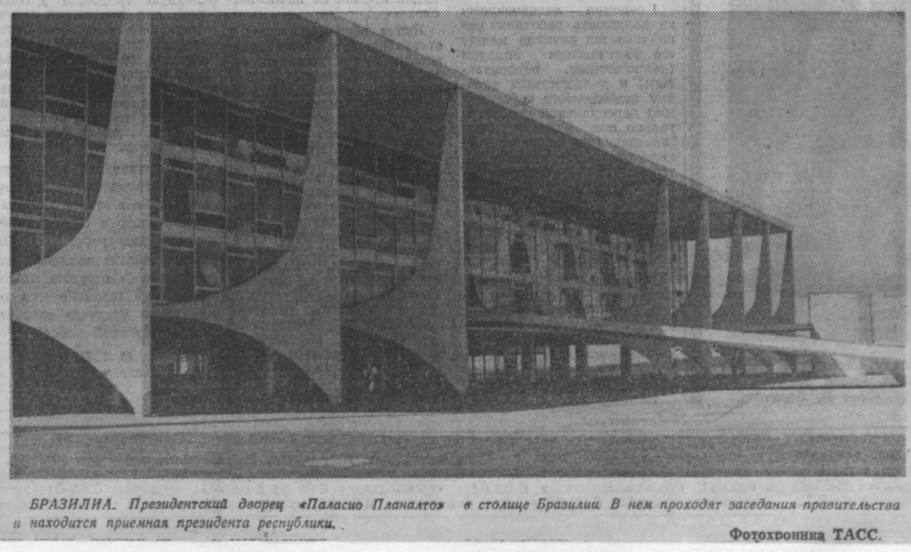
БРАЗИЛИЯ. Президентский дворец «Паласио Планалто» в столице Бразилии. В нем проходят заседания правительства и находится приемная президента республики.