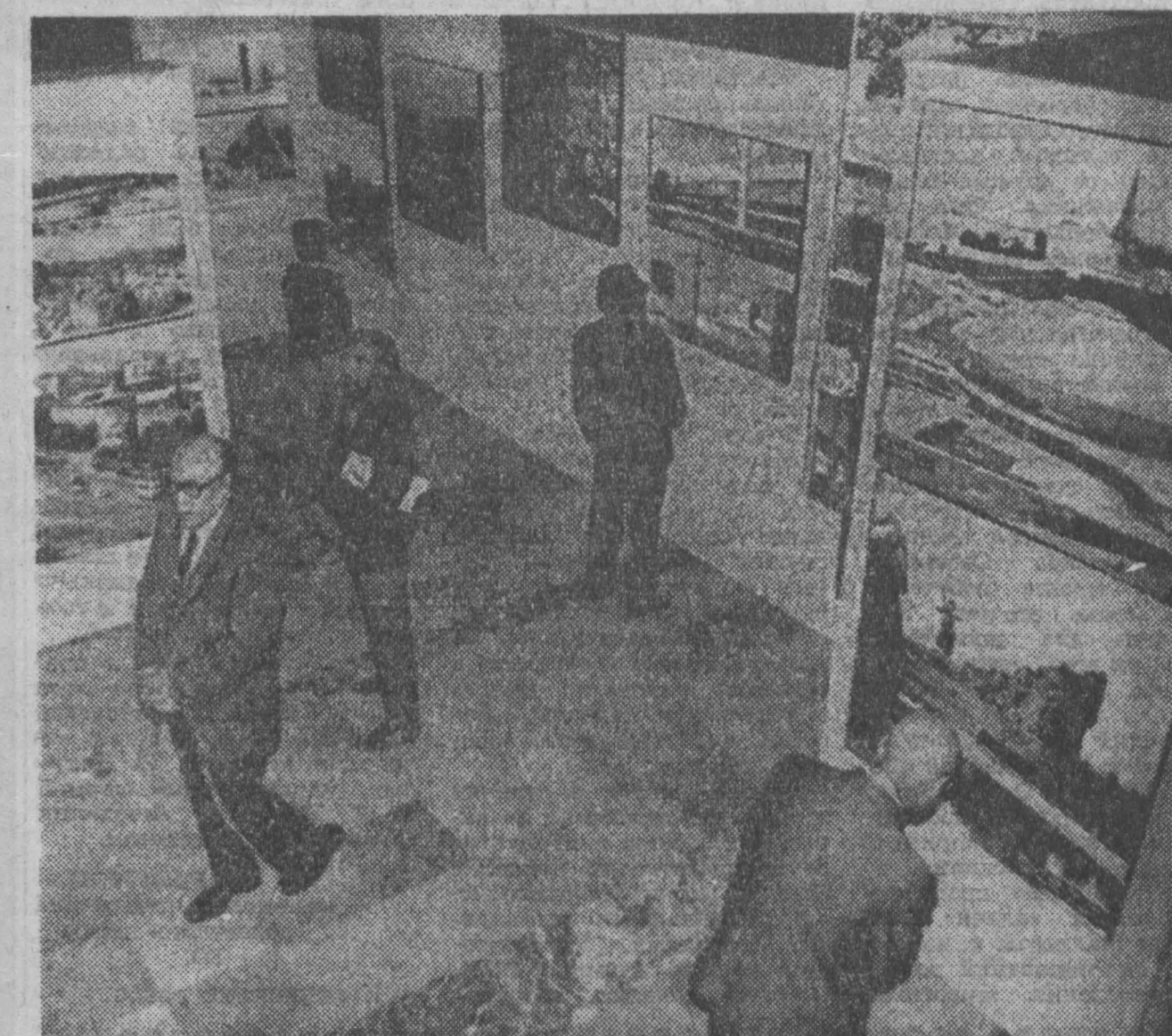
В Мехико, в культурном центре «Белье арте» открыта фотоматка памятник старинной и современной архитектуры СССР.

Министр иностранных дел Уганды В. Кибеди решительно осудил англо-родезийскую сделку относительно будущего Южной Родезии, отметив при этом, что события последних недель наглядно продемонстрировали, что народ Зимбабве отвергает условия этого договора.