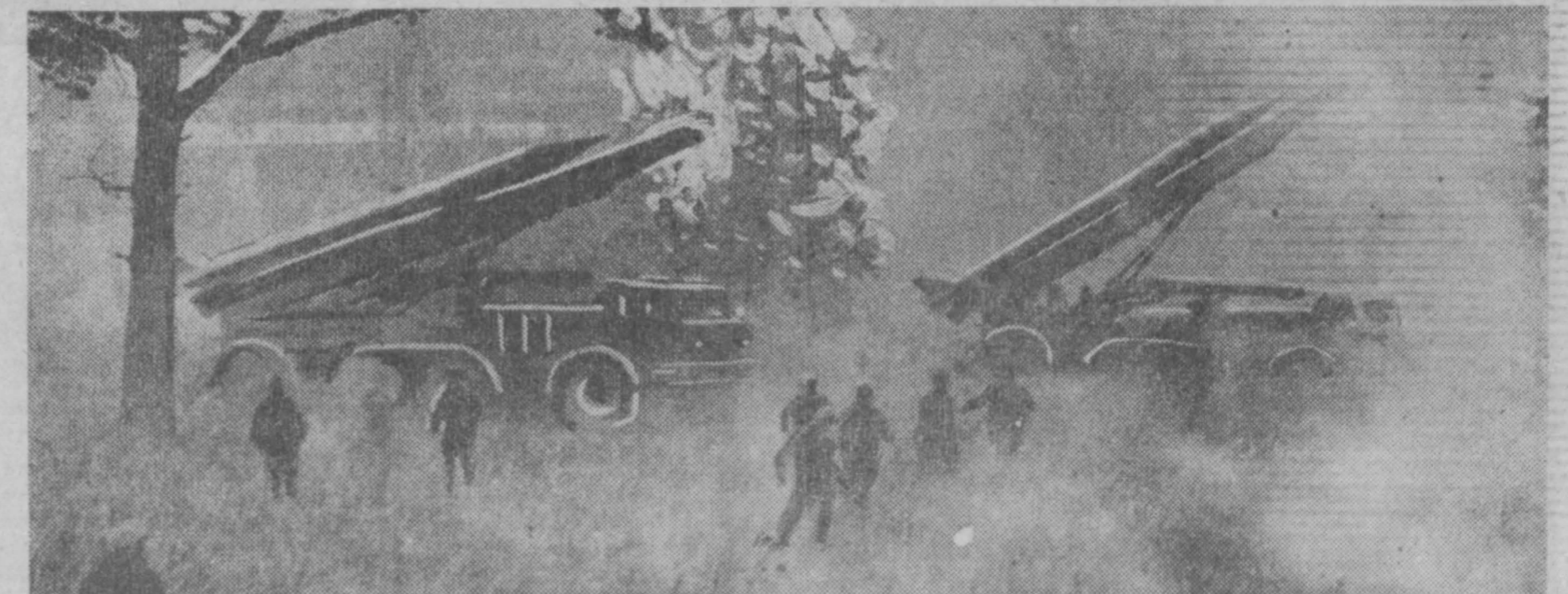
Боевая учеба ракетчиков.

Имена тысяч артиллеристов, артиллерийских частей и соединений служат и в наши дни примером непревзойденной стойкости, мужества и отваги, беззаветной преданности социалистической Родине. Никогда не выгладится в памяти советского народа подвиг артиллеристов батареи капитана Флерова, которые впервые в истории нанесли удар реактивными снарядами по скоплению врага. Тогда на станции Орша было положено начало славным боевым делам гвардейских минометных установок «Катюша».