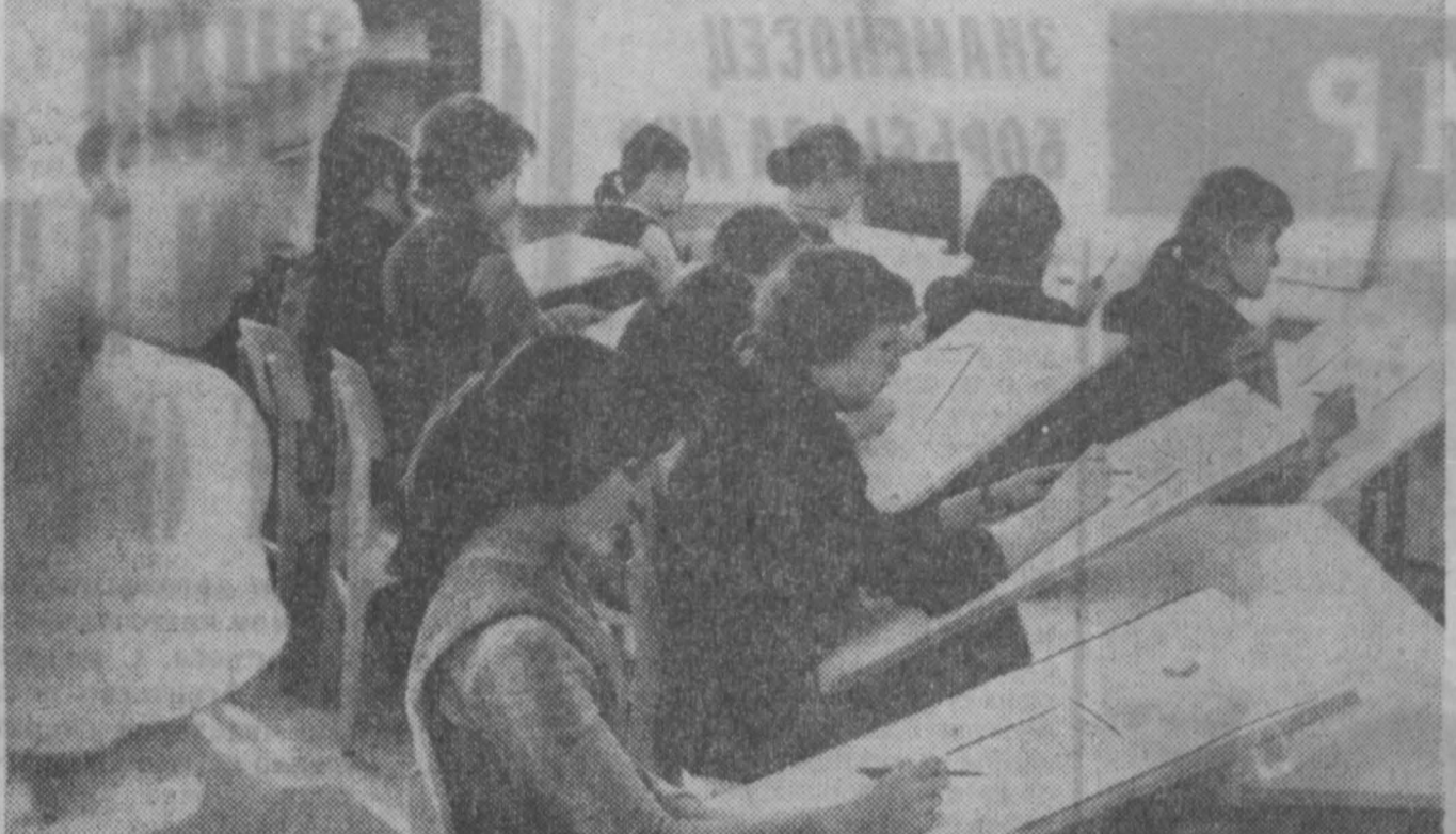
В Кемерове появилось еще одно учебное заведение — архитектурно-строительный техникум. Он готовит специалистов по архитектуре и инженерной геодезии. В этом году на первый курс принято 180 бывших восьмиклассников.

Областная комиссия по делам несовершеннолетних при облисполкоме обсудила итоги организации летнего отдыха детей в 1972 году. Доклад сделал заместитель заведующего областным отделом народного образования В. В. Филатьев.