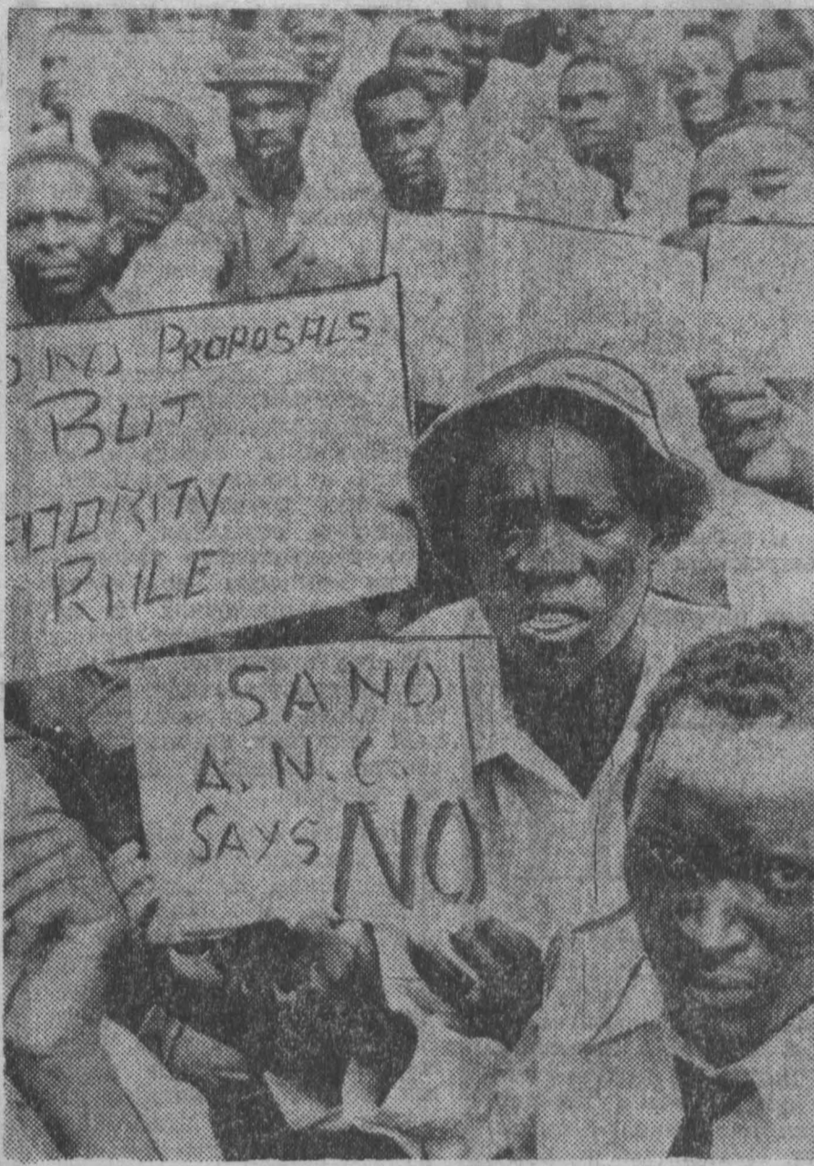
Африканское население Родезии продолжает вести борьбу против сделки между режимом Яна Смита и английскими правительством, направленной на закрепление расистских порядков в стране и на сохранение в руках белого меньшинства власти над миллионами коренных жителей. НА СНИМКЕ: демонстрация протеста против подписания англо-родезийского соглашения.

В выступлениях ораторов подчеркивается необходимость скорейшего принятия конвенции о запрещении разработки, производства и накопления запасов химического оружия и его уничтожения. В этой связи отмечена важная инициатива, предложенная социалистическими странами, разработавшими и внесшими на рассмотрение комитета проект такой конвенции.