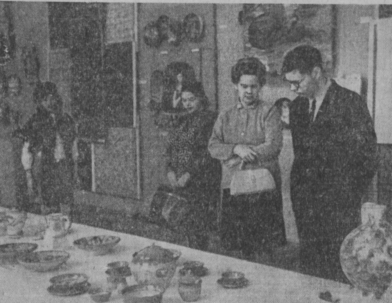
Москва. В выставочных залах МОСХа открыт второй раздел большой экспозиции «Мотивные художники к 50-летию образования СССР». На выставке представлено более тысячи работ: живопись, графика, декоративно-прикладное искусство, плакат.