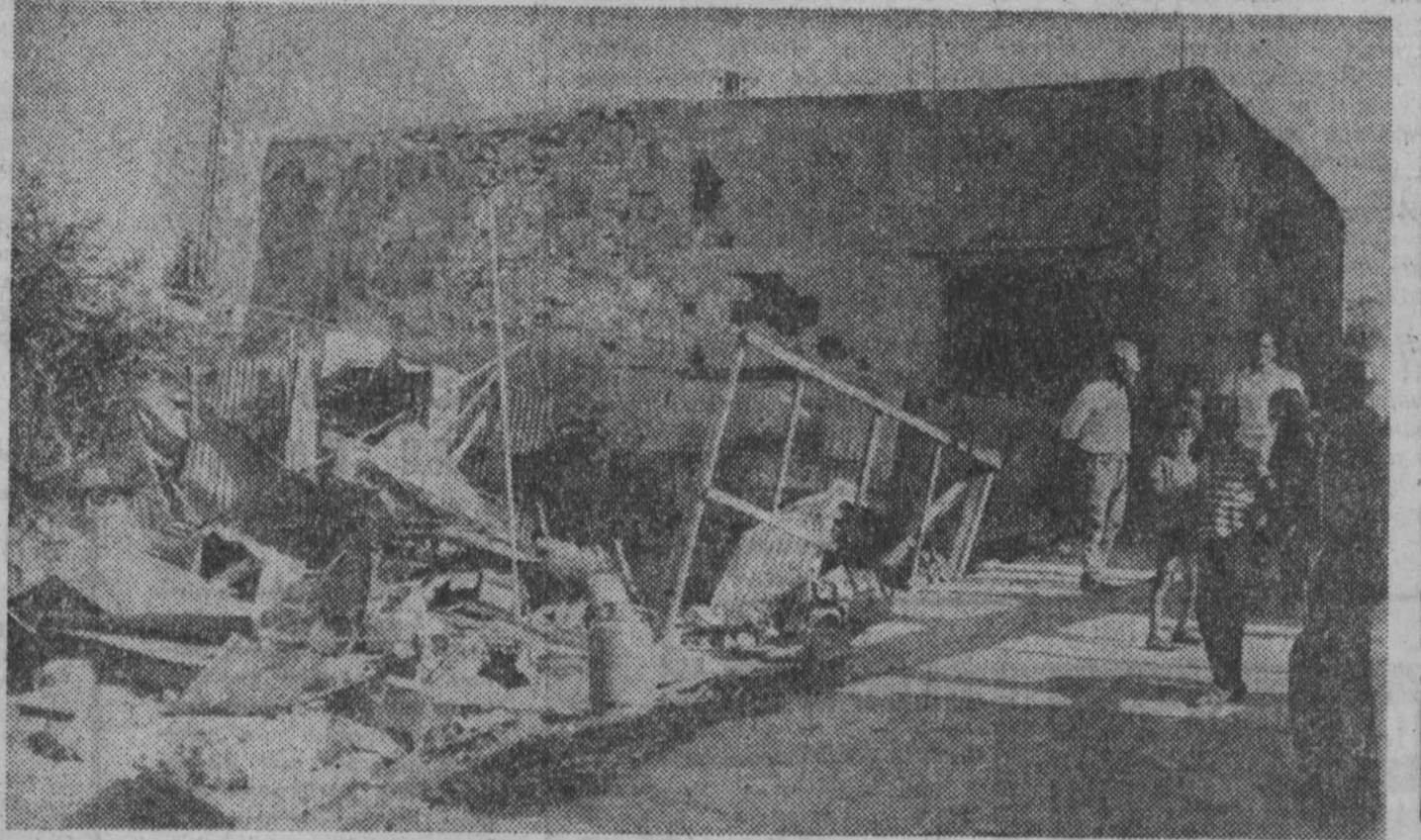
Израильская авиация продолжает совершать акты агрессии против Ливана и Сирии. Несколько населенных пунктов в этих странах подверглись бомбардировкам с воздуха. Среди населения имеются жертвы.