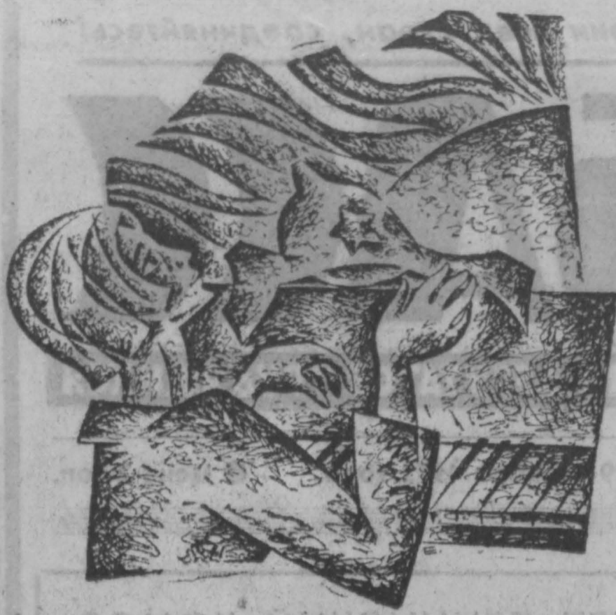
РЕВОЛЮЦИОННЫЙ ЭТОП Рис. Г. Ефремова.

И. КУТЫРЕВ: «Сами понимаете, у нас молодых, свои интересы, свои нормы. Другой возраст... Я, главное, что вижу: Олег — парень самостоятельный, цель он взял себе правильную».