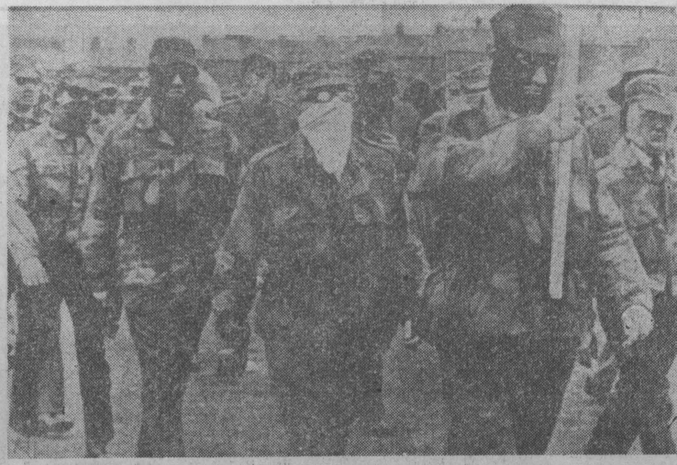
Вновь по улицам Белфаста маршируют отряды протестантских экстремистов, вновь гремит выстрел и взрывы. НА СНИМКЕ: в устрашающих масках «ультра» маршируют по улицам Белфаста.