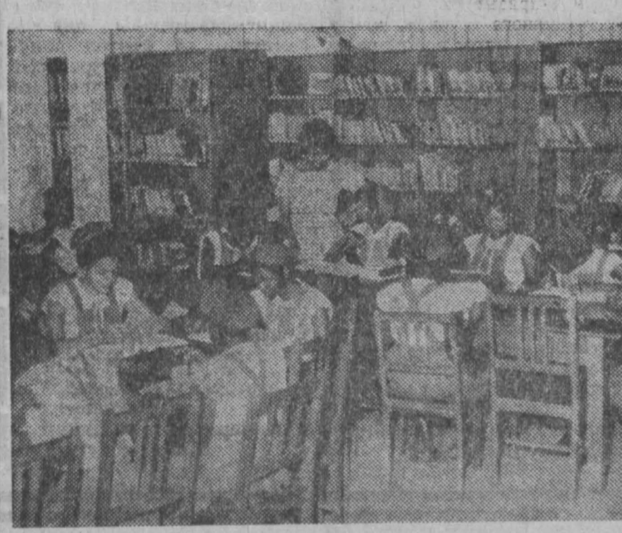
НИГЕРИЯ, освободившаяся около 12 лет назад от оков английского колониализма, успешно решает жизненно важную проблему подготовки национальных кадров. За годы независимости быстро возросло число студентов и школьников. В настоящее время по всей стране создается сеть детских садов, начальных школ, увеличивается число средних и высших учебных заведений.