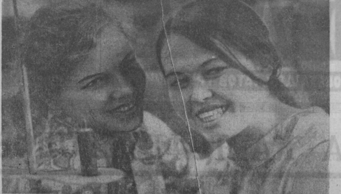
Хорошими трудовыми успехами встречают 50-летие образования СССР швей первого цеха пропиевской фабрики «Горничка».

А. ПОЗДЕЕВ, корр. «Кузбасса», г. Осинники.