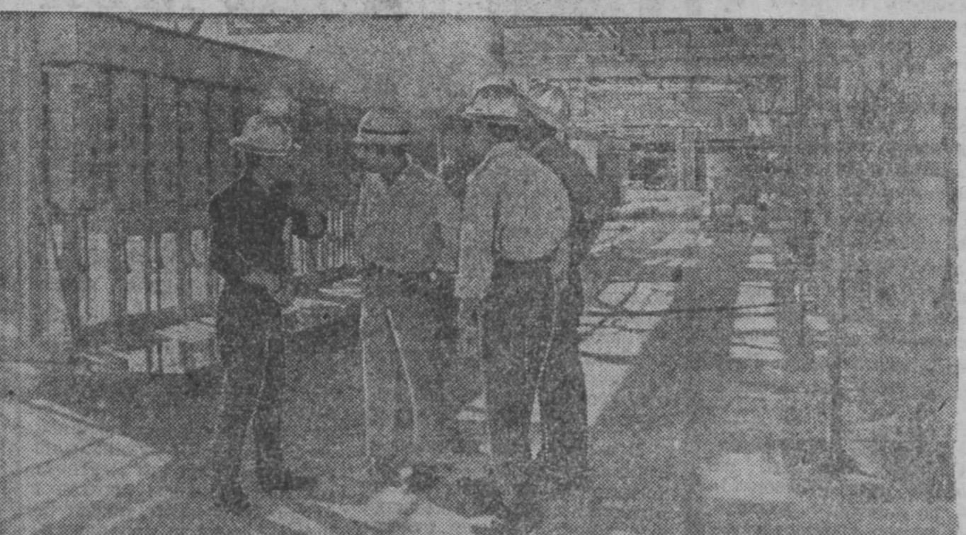
Главное богатство Ирана — нефть. Одним из центров переработки этого ценного сырья является остров Харк в Персидском заливе. Здесь сооружены современные