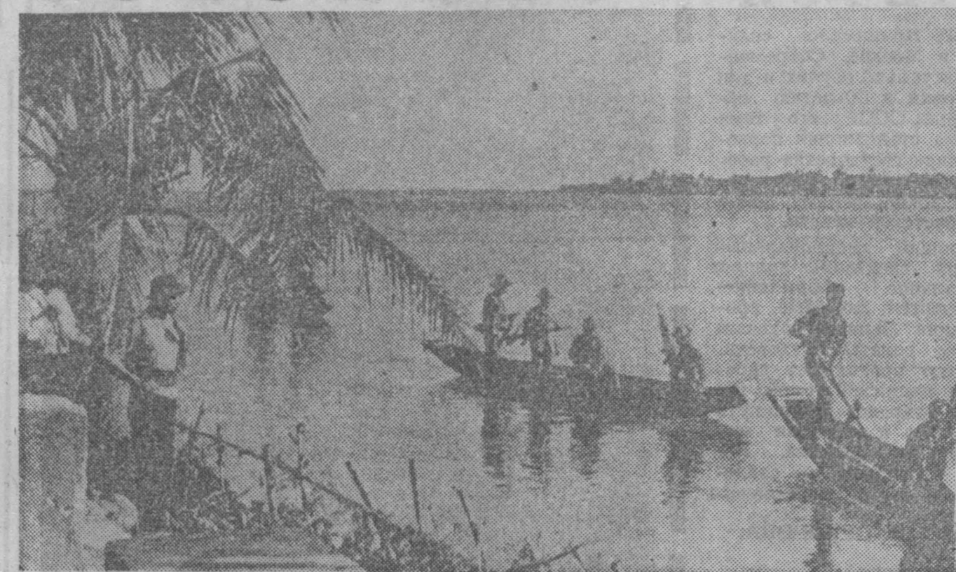
ЮЖНЫЙ ВЬЕТНАМ. Отряд бойцов НВСО несет патрульную службу на реке Тхакхань (провинция Куангчи). Значительная территория этой провинции находится под контролем патриотических сил.