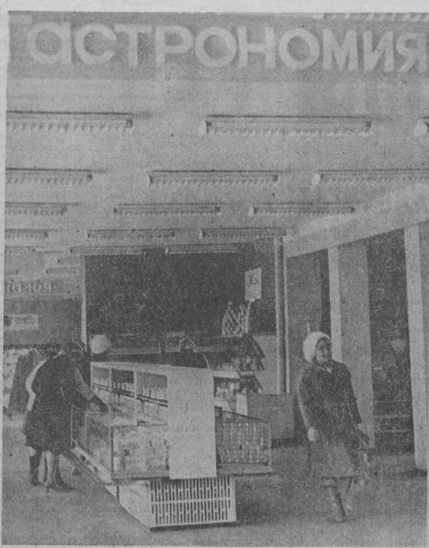
В областном центре, на проспекте имени Ленина, на днях открылся большой продовольственный магазин первого горняцетора.