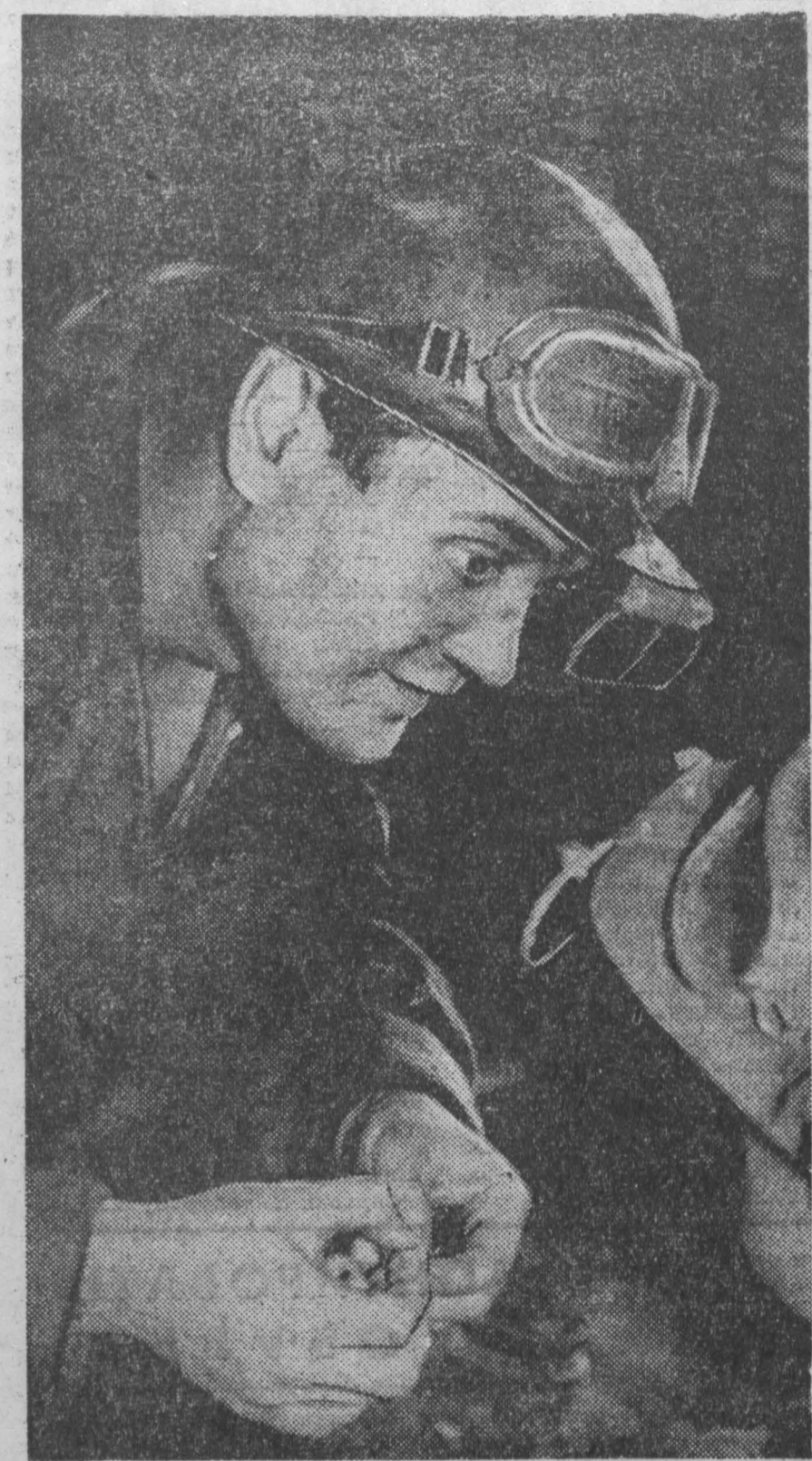
НА СНИМКАХ: та цеха «За сталь».