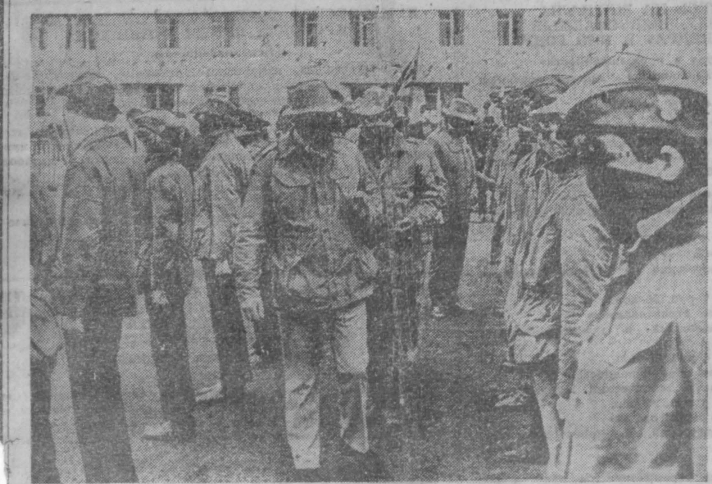
Обстановка в Северной Ирландии по-прежнему остается напряженной. Реальную угрозу представляют сейчас протестантские экстремисты. Они систематически совершают вооруженные нападения на борцов за гражданские права.