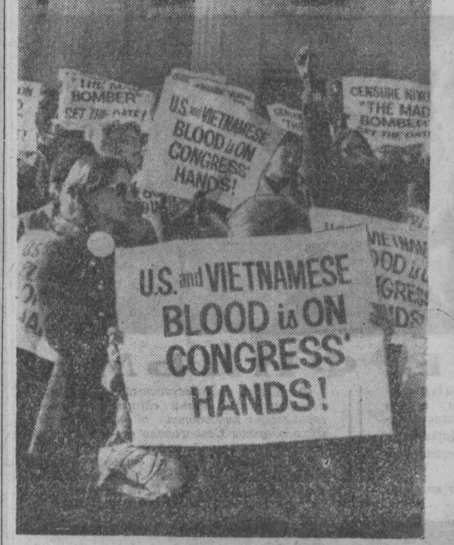
Женщины борются за мир. НА СНИМКЕ: во время демонстрации у здания Капитолия.

Способствовать этому будет созданный в Кемерове отдел производства и реализации продукции «Далырыбы». В прошлом году кемеровчане получили дополнительную к выделенным фондам рыбопродукции на миллион рублей. Ныне в январе фирменным станет магазин «Далырыбы», а в феврале оборудуются рыбный магазин на