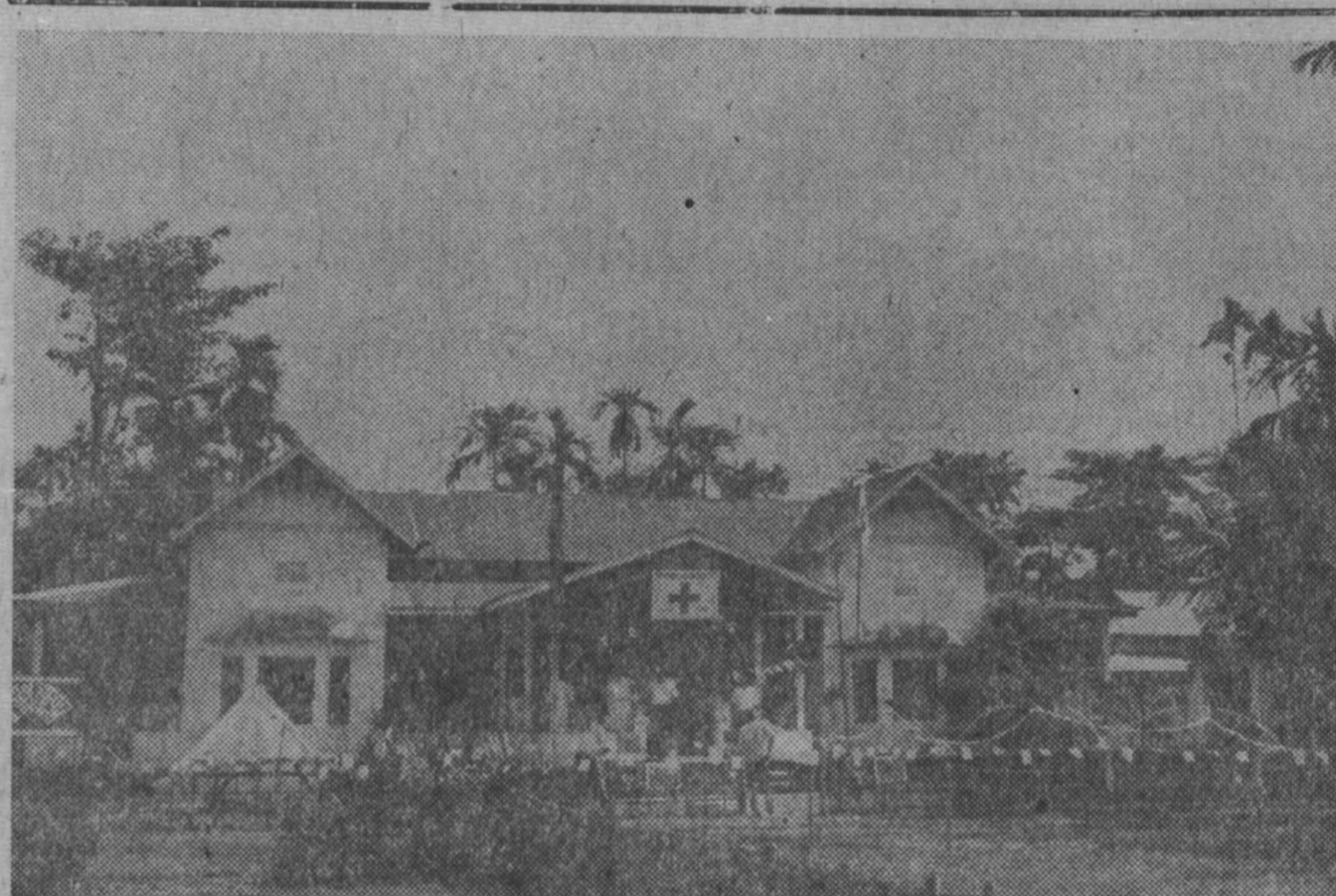
Международный Красный Крест проводит большую работу по оказанию помощи населению Бангладеш...