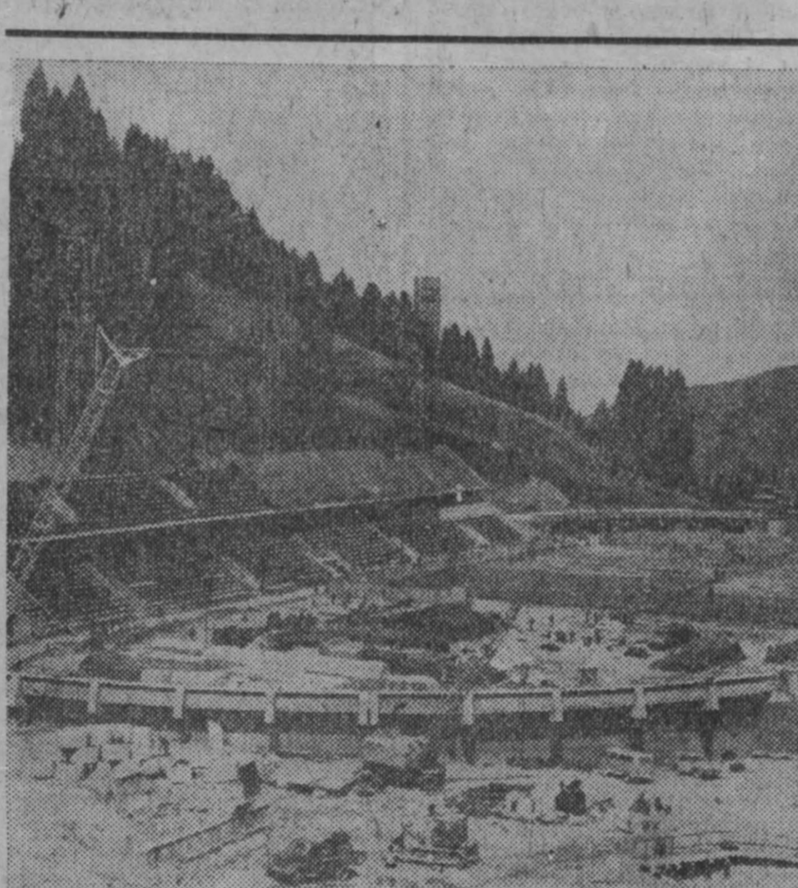
В урочище Медео, близ Алма-Аты, строится новый высокогорный каток. На высоте около 1700 метров над уровнем моря располагается чаша ледового стадиона, внутри которой укладывается 160 км. ленточной трубой холодильной установкой. Трибуны рассчитаны на 10 тысяч зрителей. Под ними оборудуются гардеробы для спортсменов, врачебные кабинеты, судейские комнаты.

Рядом со стадионом будут построены плавательный бассейн и гостиничный городок. НА СНИМКЕ: строительство высокогорного катка в урочище Медео.