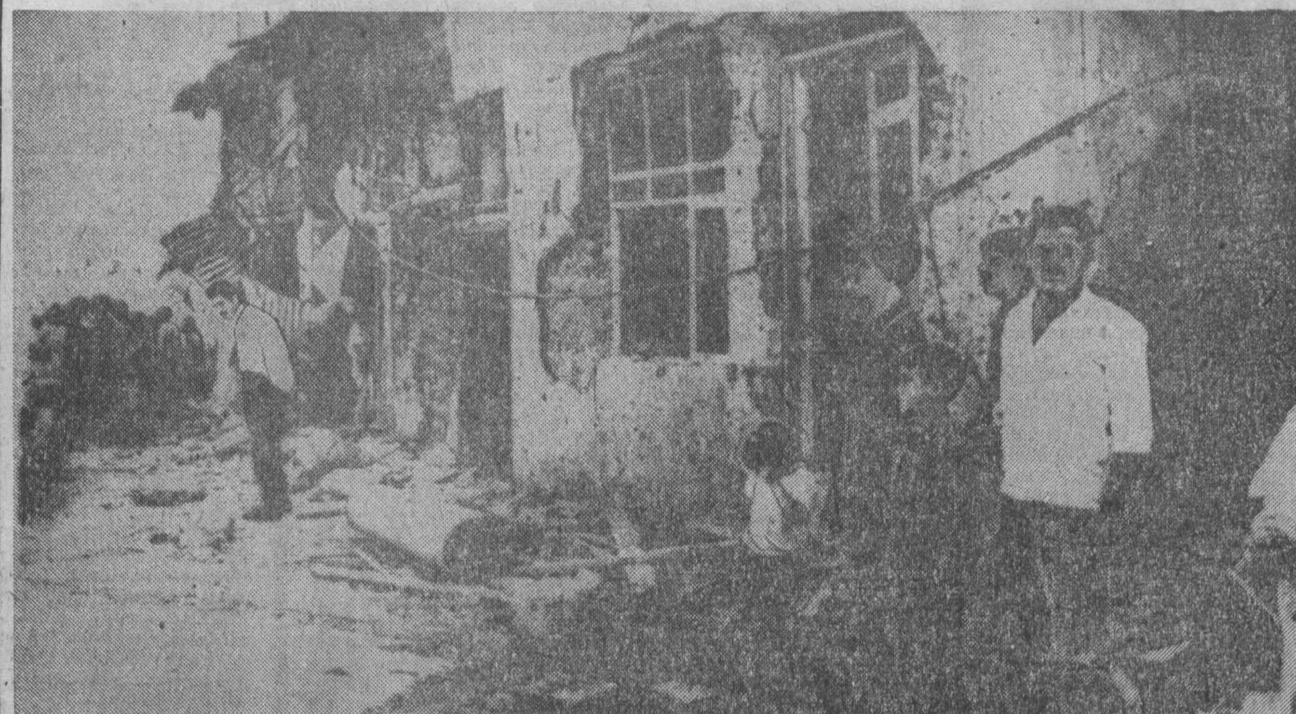
Разрушенные дома, убитые и раненые, из которых большинство женщины и дети, — таково последствие налета израильской авиации на населенные пункты Сирии и Ливана. На территории Сирии бомбардировкам и обстрелу ракетными под-