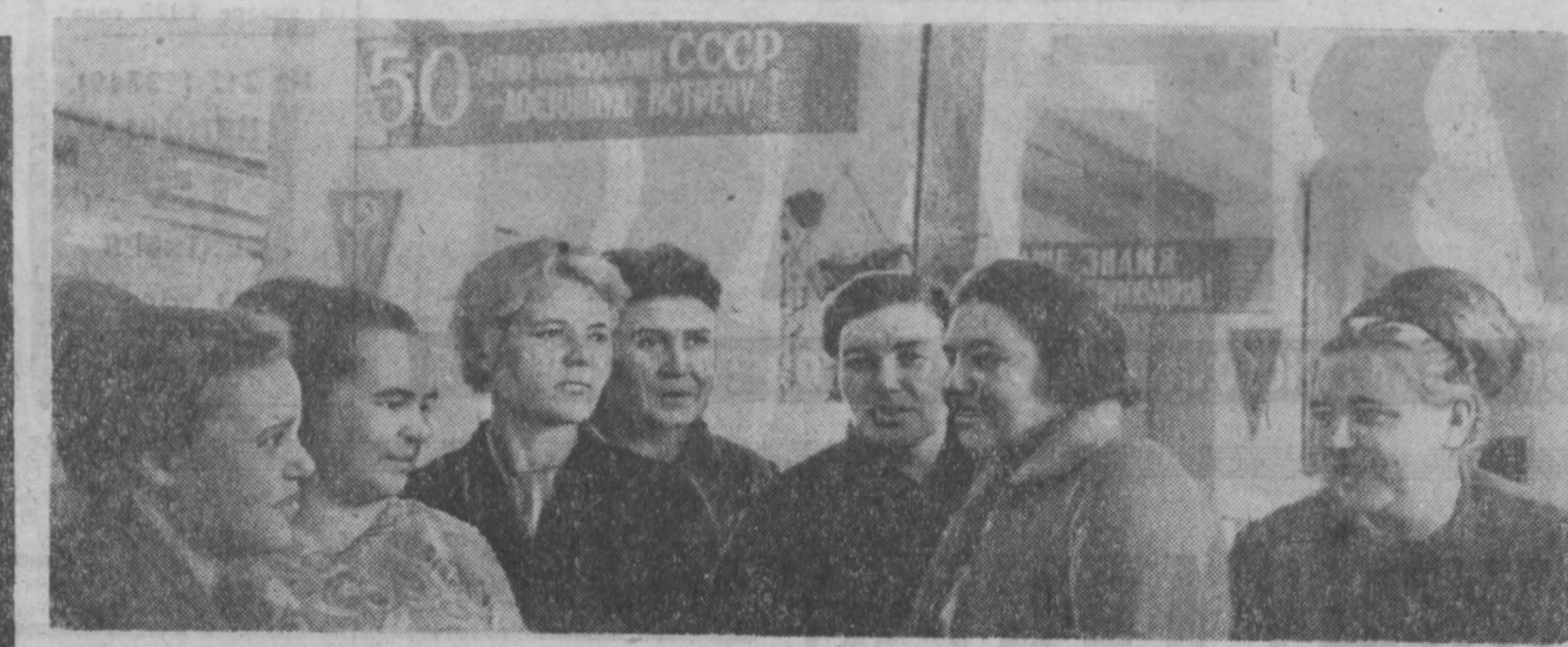
Коллектив швейной фабрики «Томь» готовит добротную одежду к зимнему сезону. На консьерах сейчас дошиваются тысячи пальто...