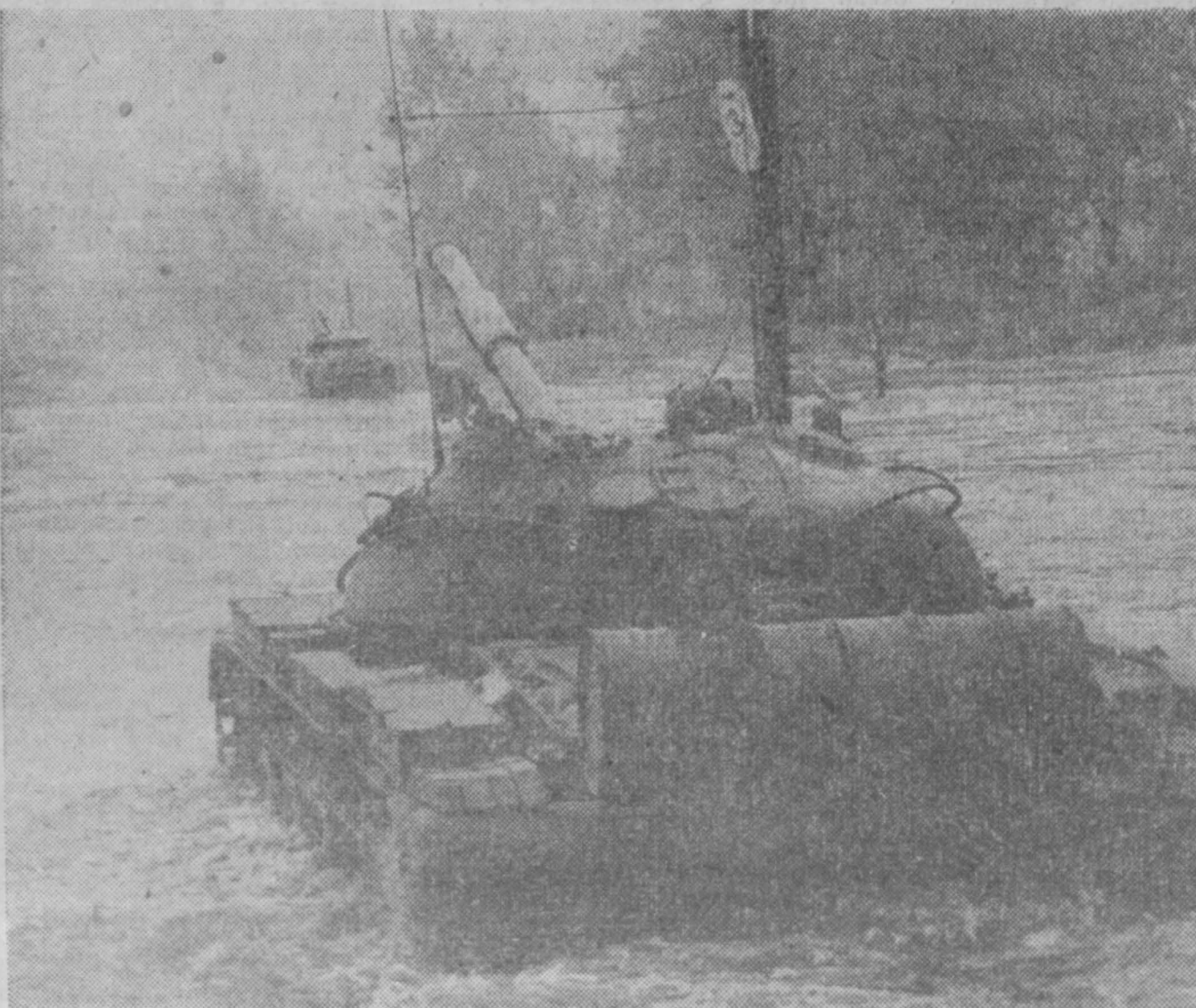
Танки форсируют водную преграду.

В боевом ряду Советских Вооруженных Сил достойное место занимают танковые войска. Об их технике, повседневной учебе рассказывал корреспондент ТАСС начальник танковых войск, в арде бронетанковых войск А. Х. БАВАДЖА.