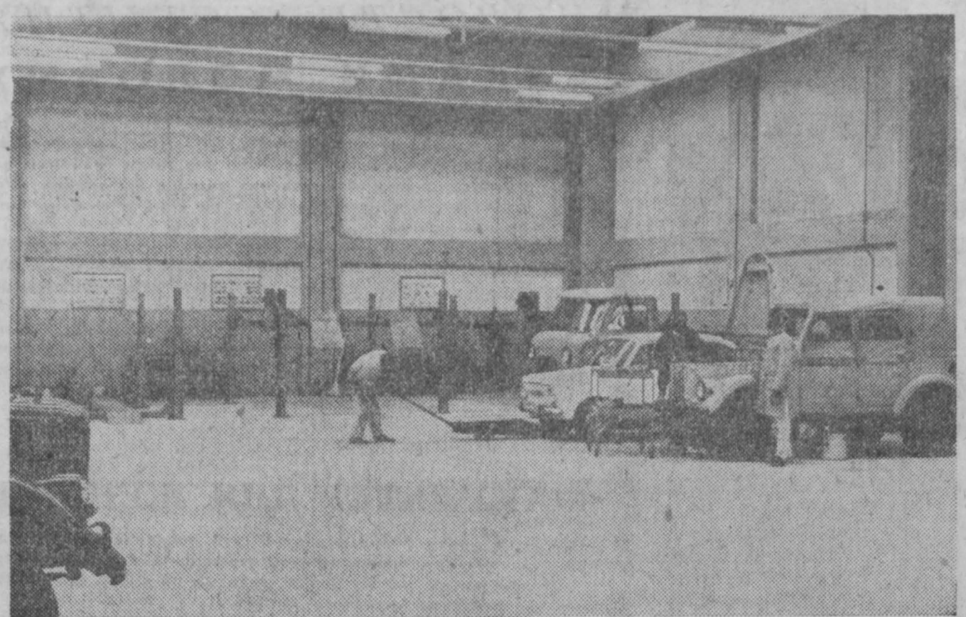
ЗЕНОБИЯ. Недавно в Аддис-Абебе открылся торговый-технический центр советско-эфиопского общества «ЭФСО Трейддинг». Центр занимается продажей советских автомобилей и сельскохозяйственной техники...

ХАНОЙ. 9 сентября. (ТАСС). Авиация США подвергла 7 сентября новым налетам окрестности Хайфона, города Хонгай, Тханьхоа и Донгхой, а также многие населенные пункты в провинциях Туйенкуанг, Хайхынг, Куангбинь, Тхайбинь, Намха, Тханьхоа, Нган, Хатинь и Куангбинь.