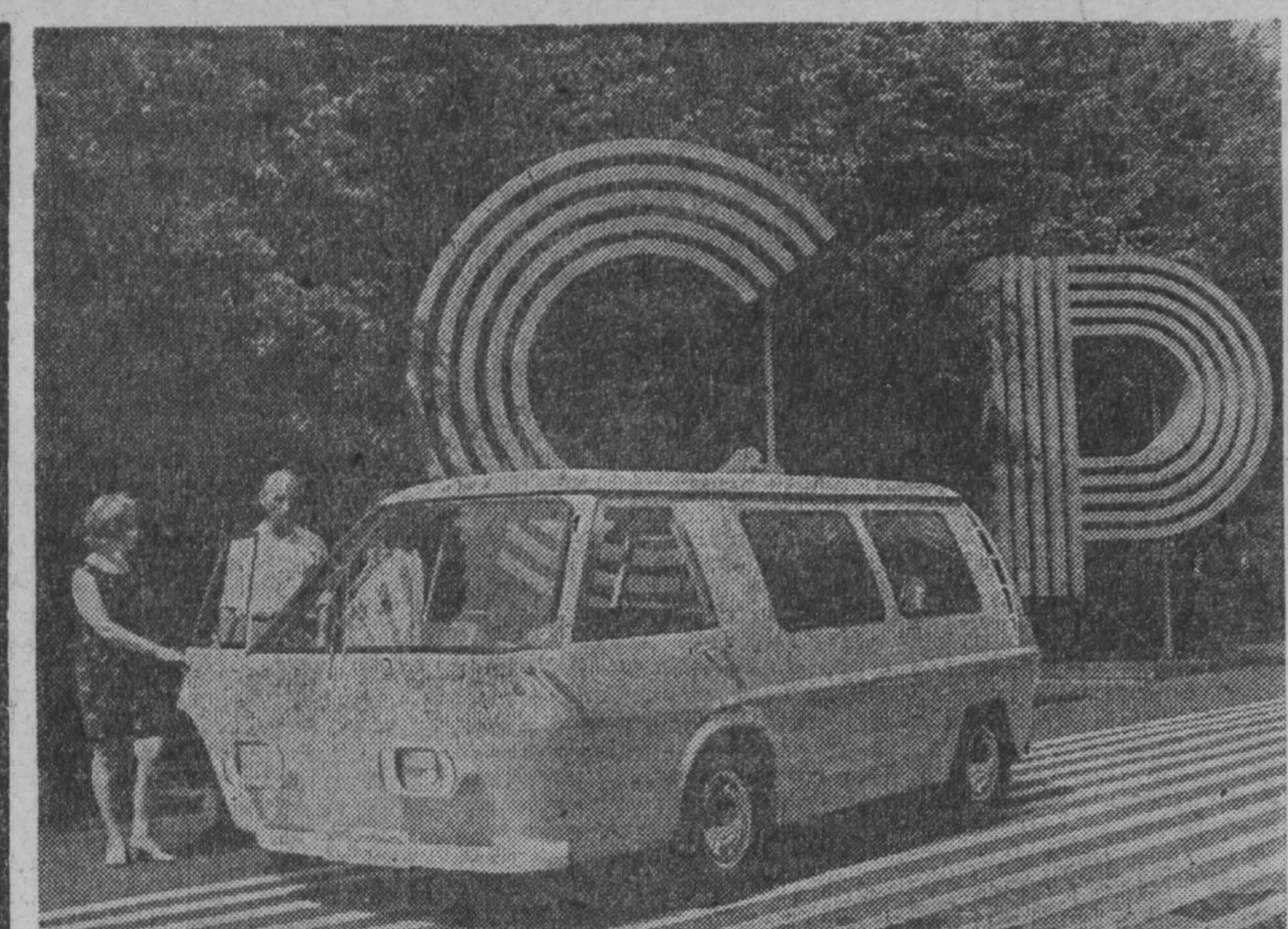
МОСКВА. Внутригородские и пригородные перевозки пассажиров и мелких партий грузов — назначение нового советского электромобиля с комбинированной энергосилой установки.

Второй эшелон. Матч между «Восток» и «Металлург» завершился победой «Востока» со счетом 2:0.