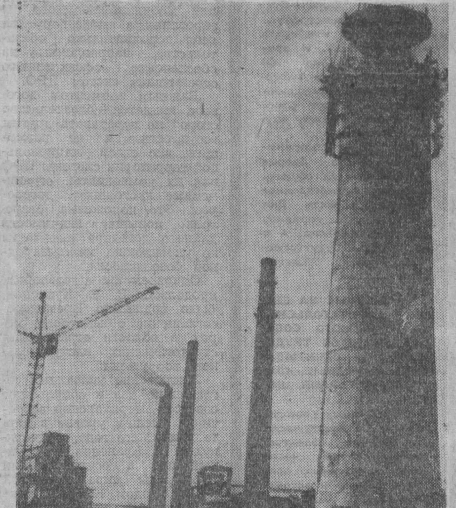
НА СНИМКАХ: монтажники Яков Ожогин; новая труба коксохимика.