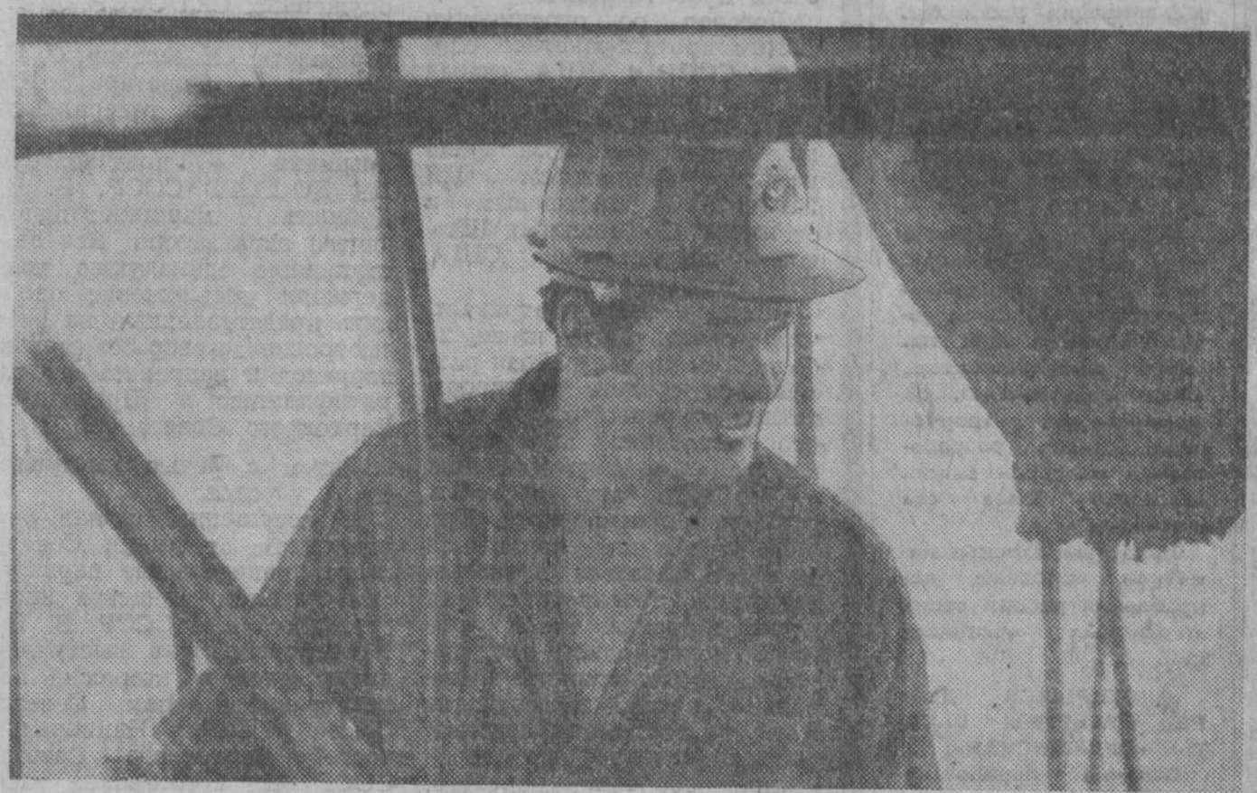
НА СООРУЖЕНИИ ШЕСТОЙ КОКСОВОЙ