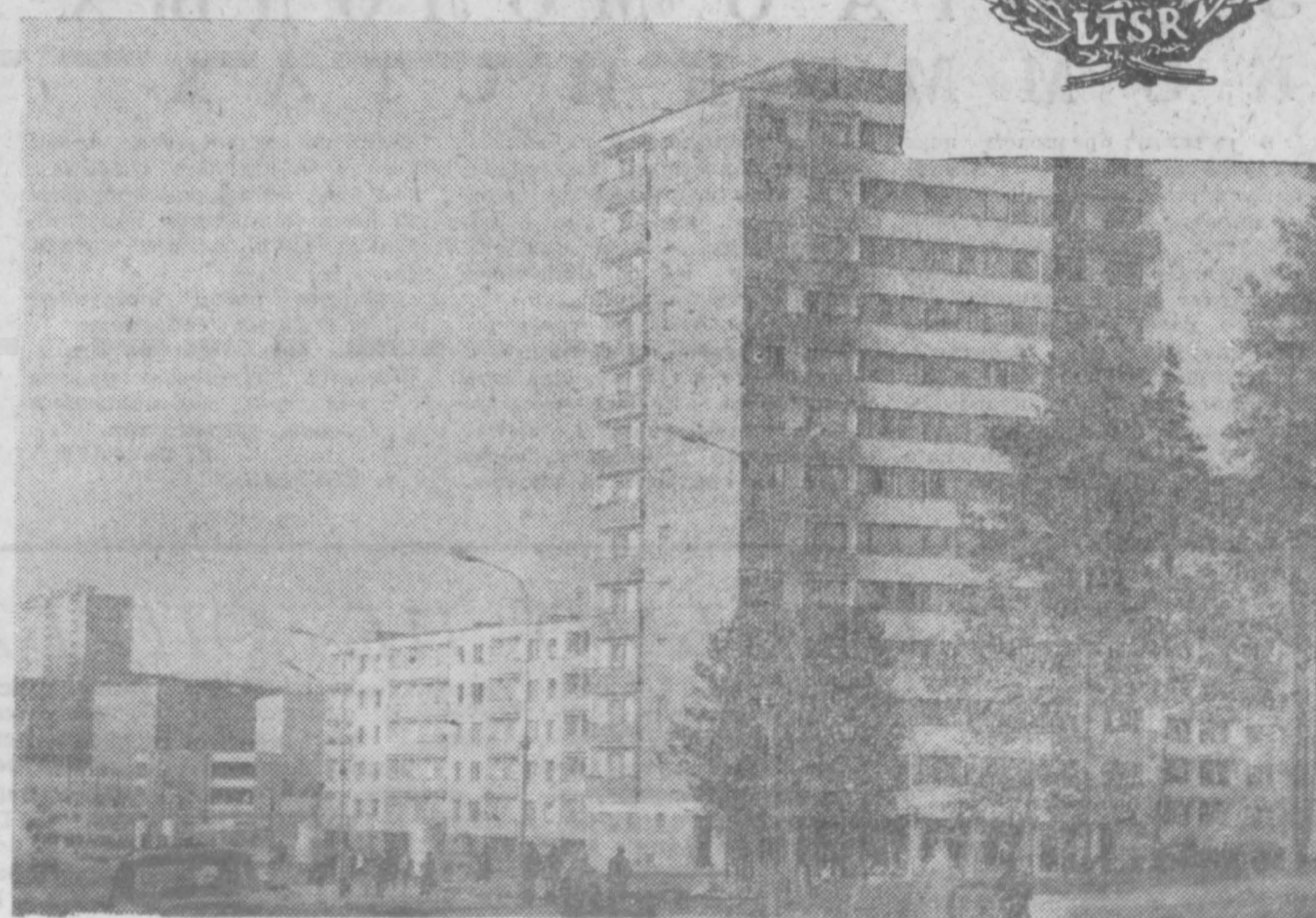
Совета Министров Литовской ССР, председатель Госплана республики

предприятий, благоустроенные дороги и чистый воздух — все нравится новоселам. НА СНИМКЕ: новые жилые дома в микрорайоне Вильнюса — Лаздинай.