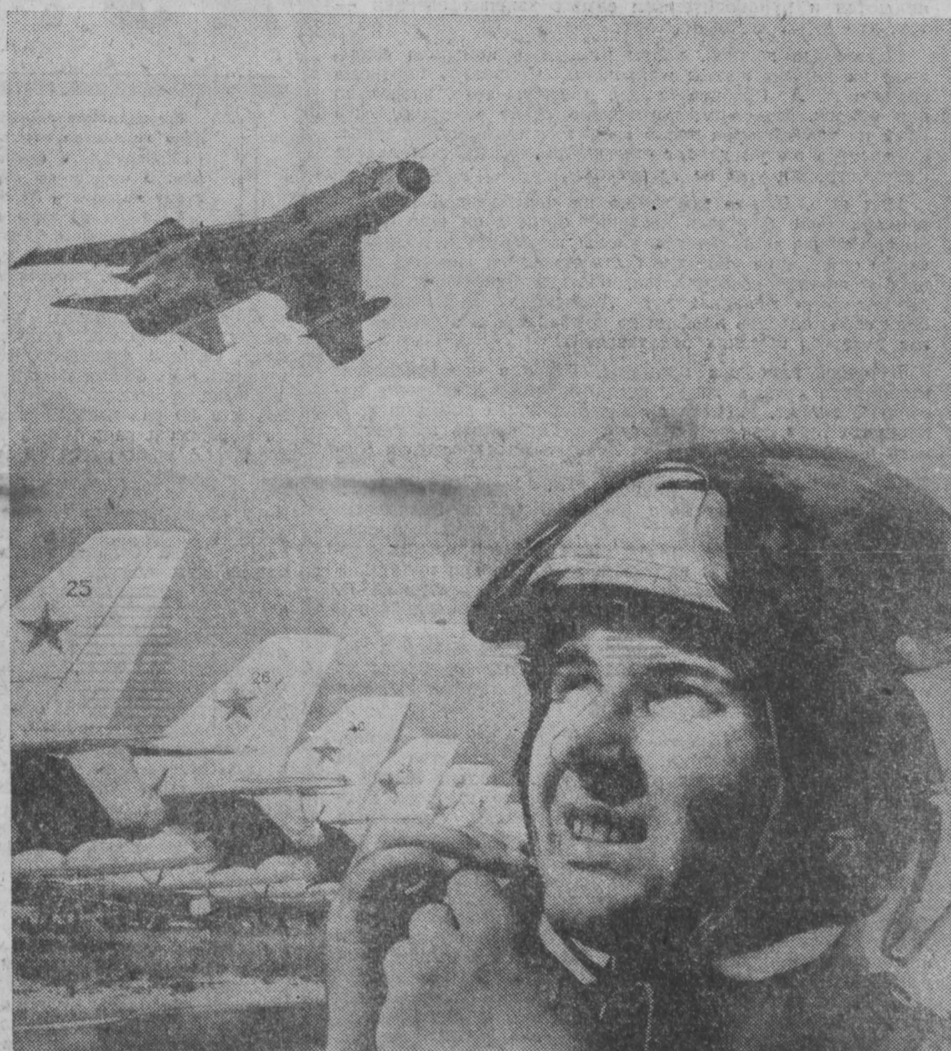
НА СТРАЖЕ СОВЕТСКОГО НЕБА