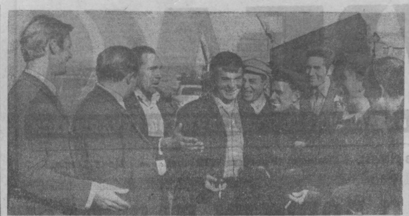
Начинается уборочная страда у хлеборобов нашей области. Выращен хороший урожай, который надо убрать в сжатые сроки и без потерь. Тысячи шоферов из городов Кузбасса отправляются на село...