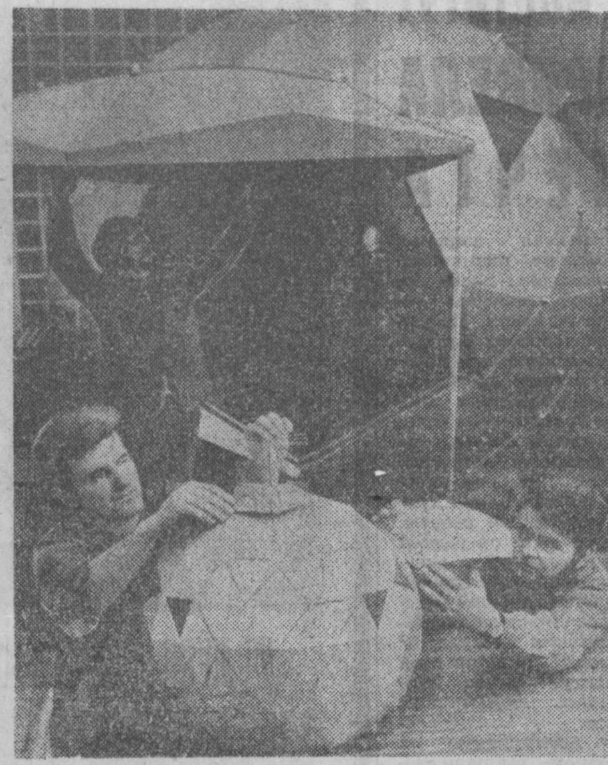
Домик для загородного отдыха оригинальной сферической формы спонструирован в Венгрии. За несколько часов два человека легко могут смонтировать на 12 секций этот летний приют, расположив его где-нибудь у речки или на лесной опушке. Общий вес сооружения — 160 килограммов.

Вскоре будет завершена реконструкция завода «Грабобласт» и фабрики искусственных кож в Дьере. Синтетические материалы и пластмассы находят все более широкое применение в транспортном машиностроении, строительной промышленности, сельском хозяйстве. (ТАСС)