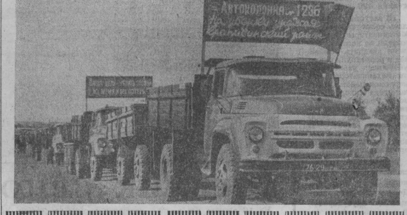
15 августа колонна машин автохозяйства № 1236 отправилась в Крайневский район. Это вторая группа машин, 50 водителей уже трудятся в районе на заготовке кормов...