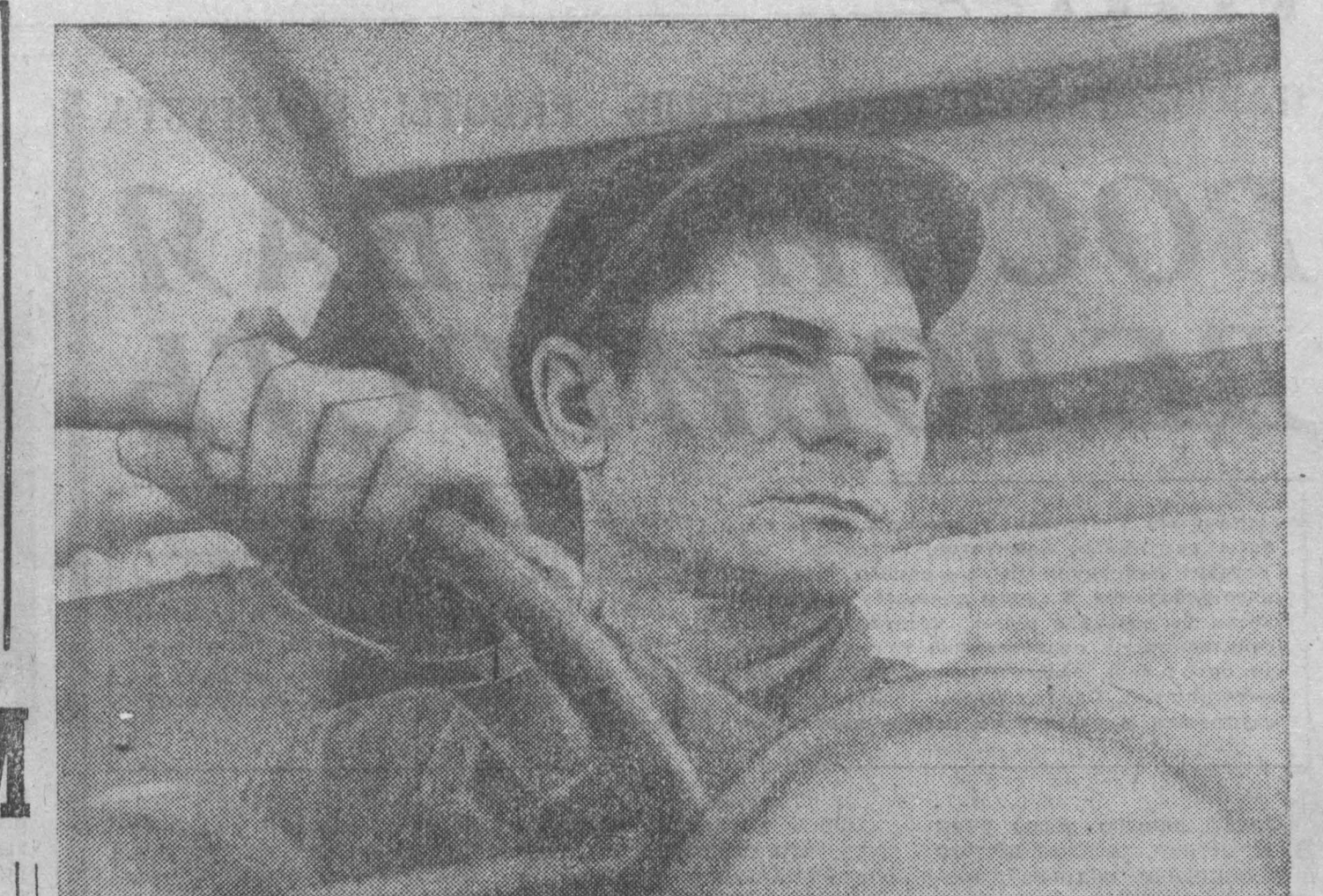
ВАСИЛИНГТОН. На международной торговой ярмарке в Сизле подписан контракт между Всесоюзным объединением «Транторгэксспорт» и американской компанией «Интернешнл харвестер» на сумму около 40 миллионов долларов.