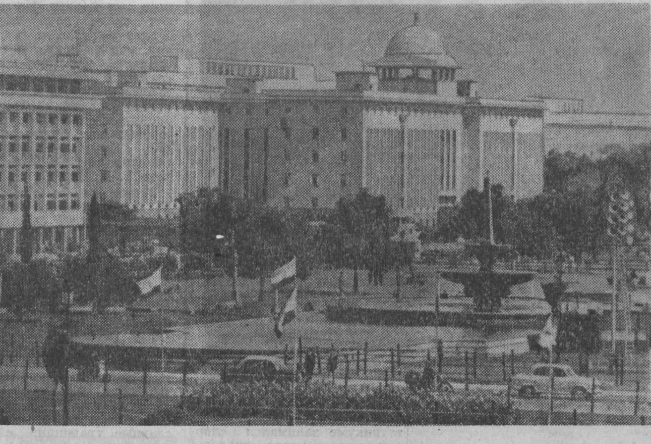
15 АВГУСТА ИСПОЛНИЛОСЬ 25 ЛЕТ СО ДНЯ ПРОВЗГЛАШЕНИЯ НЕЗАВИСИМОСТИ ИНДИИ. НА СНИМКЕ: столица Индии — Дели.

ЛОНДОН, 14 августа. (ТАСС). Израильские власти продолжают бесчинствовать на оккупированных арабских землях.