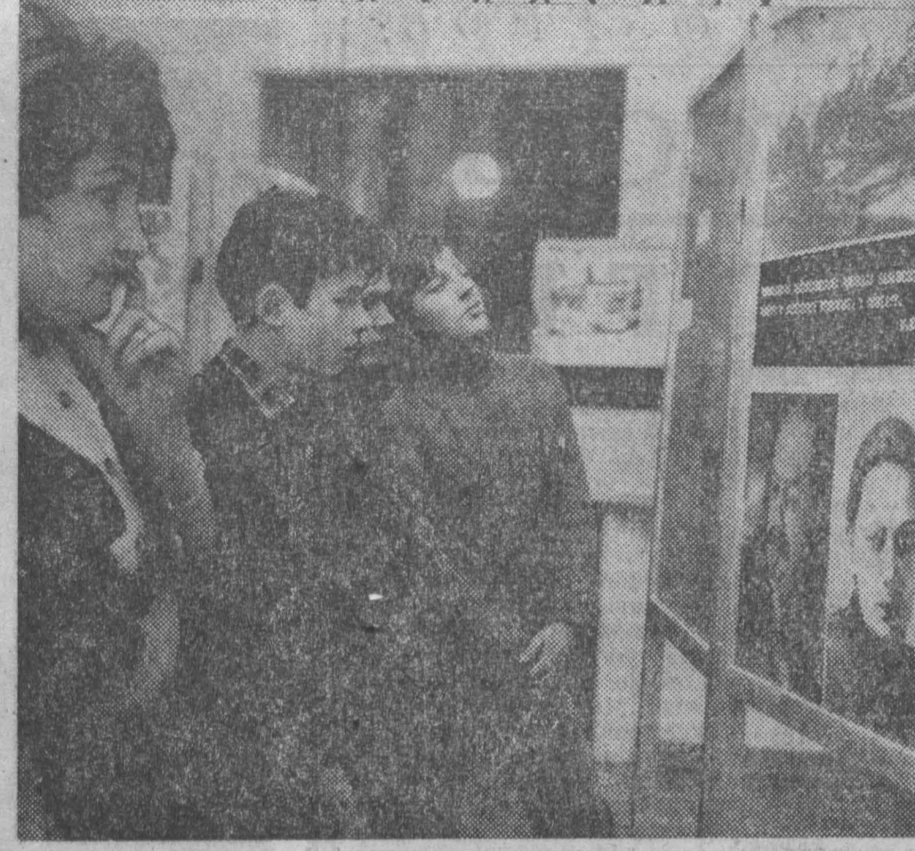
В Варшаве открылась постоянная экспозиция, посвященная жизни и деятельности вождя Великой Октябрьской социалистической революции В. И. Ленина. НА СНИМКЕ: в зале экспозиции.

В течение четверти века в индийско-советских отношениях не было каких-либо провалов. Они неуклонно развивались в духе дружбы и взаимопонимания. В этом отношении Индия многим обязана мудрости и прозорливости Джавахарлала Неру, который заложил основы для длительного и плодотворного сотрудничества с Советским Союзом. Его преемники также прекрасно понимали все достоинства и отличительные стороны индийско-советских связей. Советское руководство продемонстрировало не только чуткость и отзывчивость, но и глубокое понимание надежд и чаяний индийского народа.