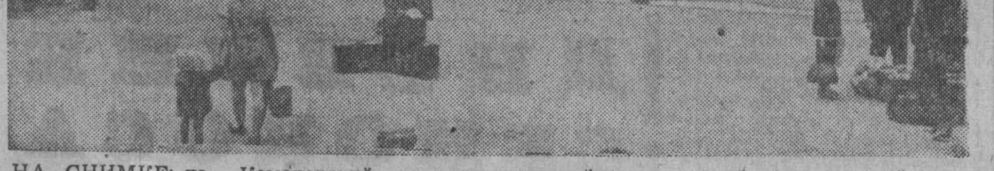
НА СНИМКЕ: на Кемеровский железнодорожный вокзал прибыл московский поезд.