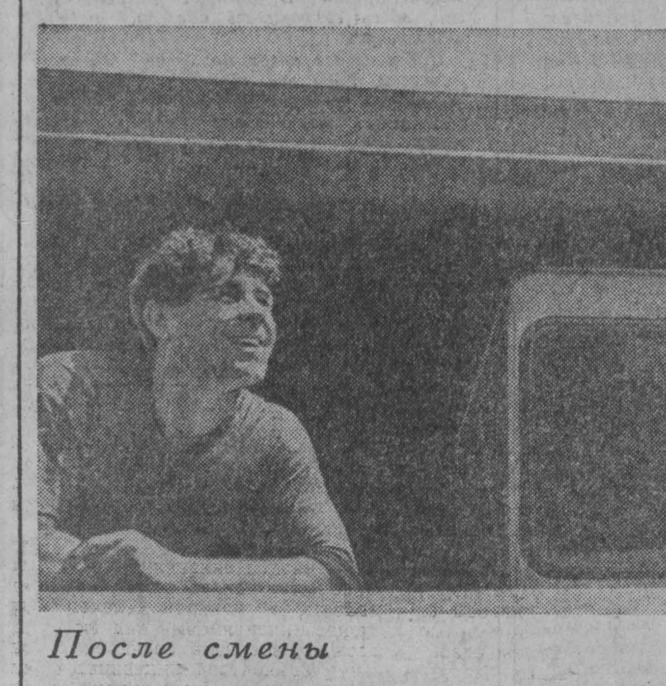
После смены

КЕМЕРОВСКОЕ ГОРПРОФТЕХУЧИЛИЩЕ № 6 ОБЪЯВЛЯЕТ ПРИЕМ УЧАЩИХСЯ на 1972-73 учебный год Училище готовит: продавцов продовольственных и промышленных товаров; поваров. Срок обучения один и два года. Принимаются юноши и девушки в возрасте 15 лет и старше с образованием 8-10 классов, стипендия 26 рублей в месяц. Остроужающиеся обеспечиваются общежитием. Принимать без экзаменов. Выплачиваются квартплаты 5 рублей в месяц. К зачислению на имя директора училища прилагаются: свидетельство об образовании (в подлиннике), свидетельство о рождении, справку с места жительства, характеристику, медицинскую справку формы № 288, автобиографию, 4 фотографии разм. 3х4 см. Адрес училища: Кировский район, ул. Халтуряна, 19. Проезд автобусом № 53 до остановки «3-й Особый», трамваем № 3 до остановки «Строммаш».