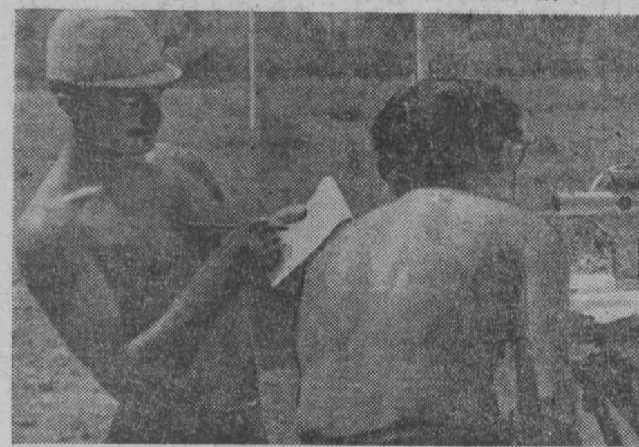
У студентов третьего курса механико-строительного факультета Сибирского металлургического института...