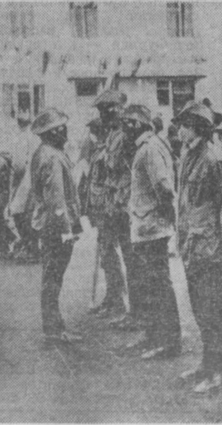
(АПН — «Нойе дайт»).

Газета «Нойе дайт» опубликовала статью своего корреспондента в Сантьяго об успешной борьбе с саботажем и спекуляцией. Агентство печати «Новости» предлагает вниманию читателей эту статью с сокращениями.