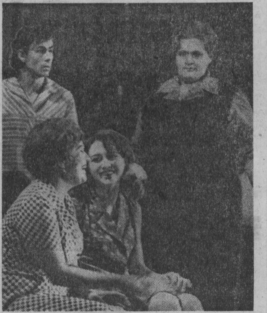
«Дом под солнцем» — спектакль кузбасского театра оперетты.