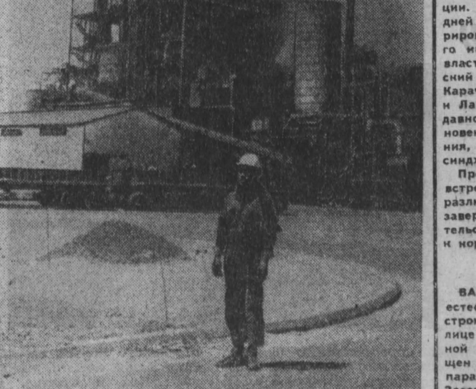
В Магнитогорске за годы независимости родилась и быстро развивается горнорудная промышленность. Одним из богатейших месторождений является Акужский бассейн, запасы которого, по мнению специалистов, составляют полмиллиона тонн чистой руды. НА СНИМКЕ: общий вид обогатительного комбината Акужуга.