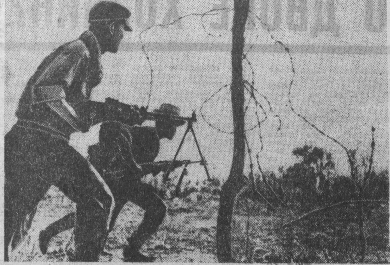
КАМБОДЖА. Силы патриотов нанесли ряд ударов по противнику недалеко от столицы Камбоджи и обстреливали провинциальный город Пномпеня — Тхмлуэн. НА СНИМКЕ: атакуют камбоджийские патриоты.