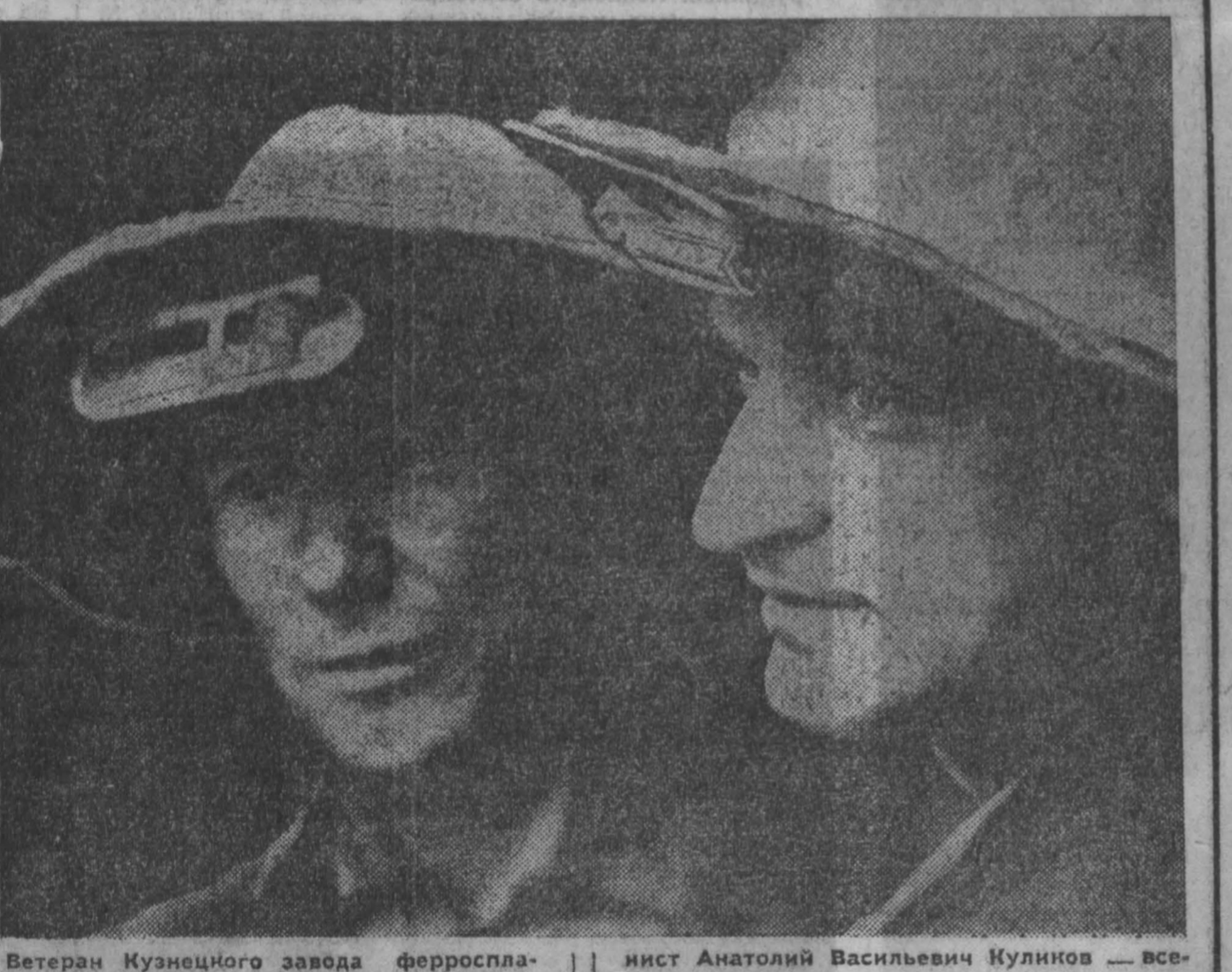
Ветеран Кузнецкого завода ферросплавов, помощник старшего плавильщика...