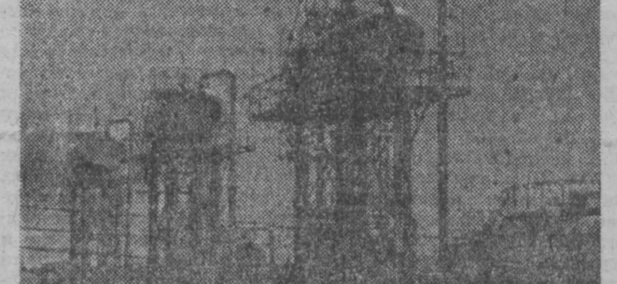
Первый национальный нефтепромысел Ирана в Северной Румелии сооружен при техническом и экономическом содействии Советского Союза. Это месторождение будет давать 5 миллионов тонн нефти в год. В дальнейшем ее добыча будет доведена до 18 миллионов тонн.