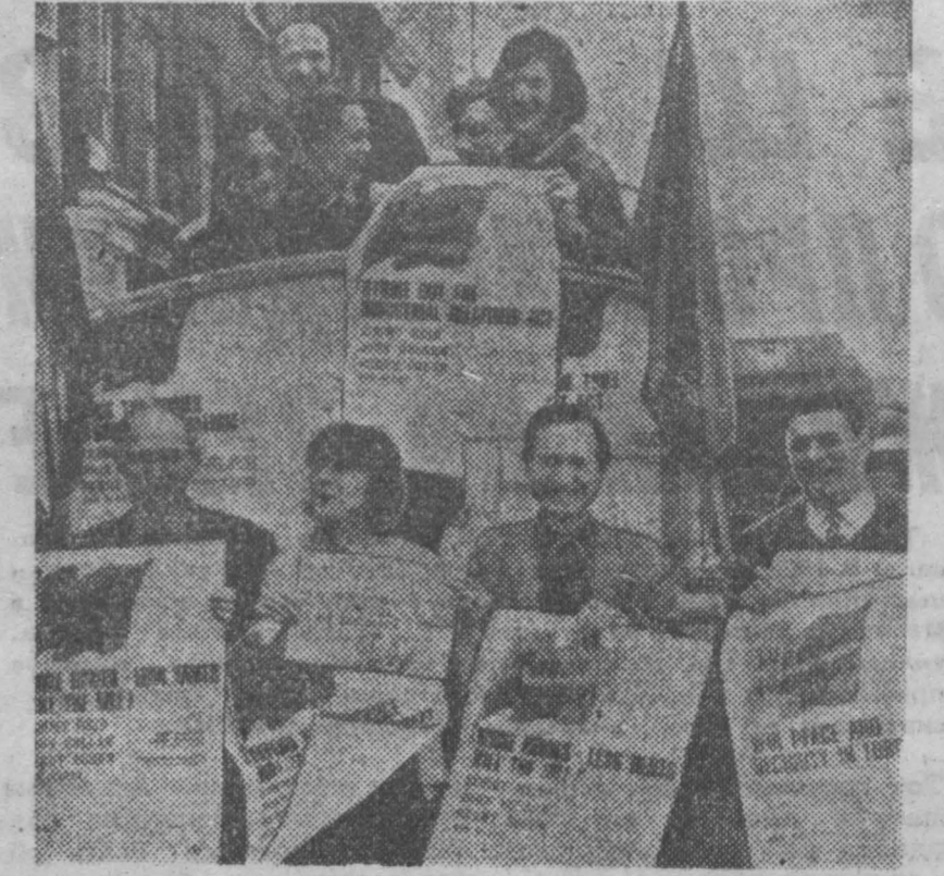
АНГЛИЯ. Районные организации коммунистической партии в Лондоне часто устраивают митинги трудящихся столицы, на которых обсуждаются вопросы прав и безопасности в Европе, разоблачаются промисы правительства консервативов, перед рабочими ставятся конкретные цели их борьбы против эксплуататоров.

Вашингтон, 15 июля. Президент Р. Никсон встретился в своей калифорнийской резиденции Сай-Клементе с послом СССР в США А. Ф. Добрыниным. На встрече присутствовал специальный помощник прези-