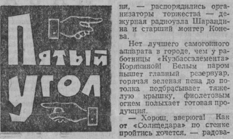
НЕ ПЕЙ ДО ДНА РУБРИКА ВВЕДЕНА ТОЛЬКО ЧТО УЧРЕЖДЕННЫМ В «ПЯТОМ УГЛУ» ОТДЕЛОМ ТРЕЗВОСТИ.

Не смог он до совхоза добраться. Дорога там плохая. Горевал и убивался долго по этому поводу. В отпуску мы его отравили, нервы лечить.