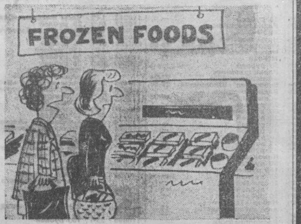
В Великобритании наблюдается постоянный рост цен на продукты питания

ТОКИО. Японская столица, еще вчера заваленная от недостатка воды, сегодня страдает от ее избытка.