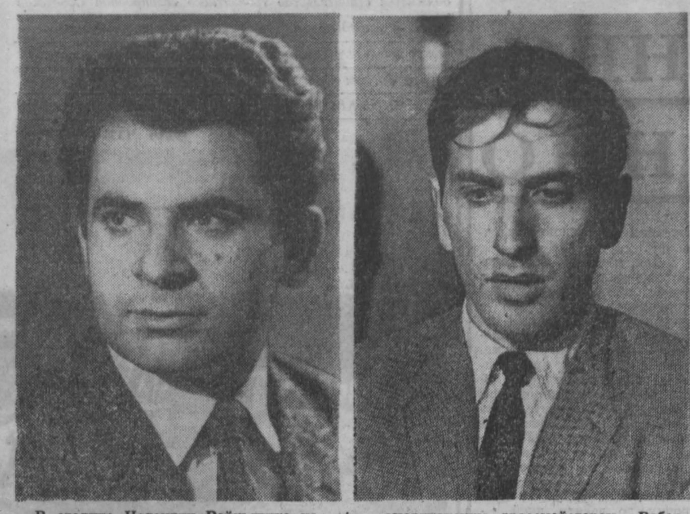
В столице Исландии Рейкьявике начинается матч на первенство мира по шахматам между чемпионом мира советским гроссмейстером Борисом Спасским и претендентом на этот титул американским гроссмейстером Робертом Фишером.