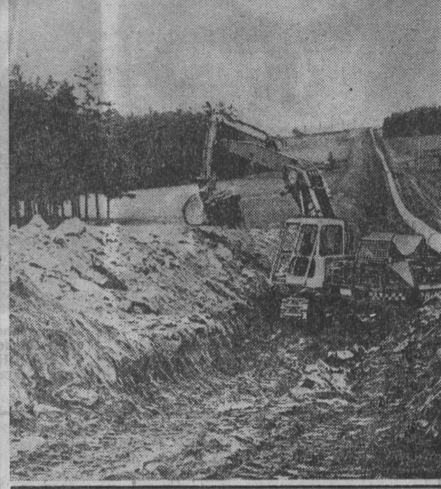
НА СНИМКЕ: участок трассы газопровода на территории Моравии.